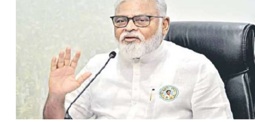
ఉండే కొందరు వ్యక్తులు అత్యంత అసభ్య పదజాలంతో ఇబ్బందుల్నిపెట్టు మాట్లాడుతున్నా... వారిపై పోలీసులు ఎందుకు చర్యలు తీసుకోవడం లేదని, చట్టం అందరికీ ఒకేలా ఎందుకు వర్తించడం లేదని నిలదీశారు.