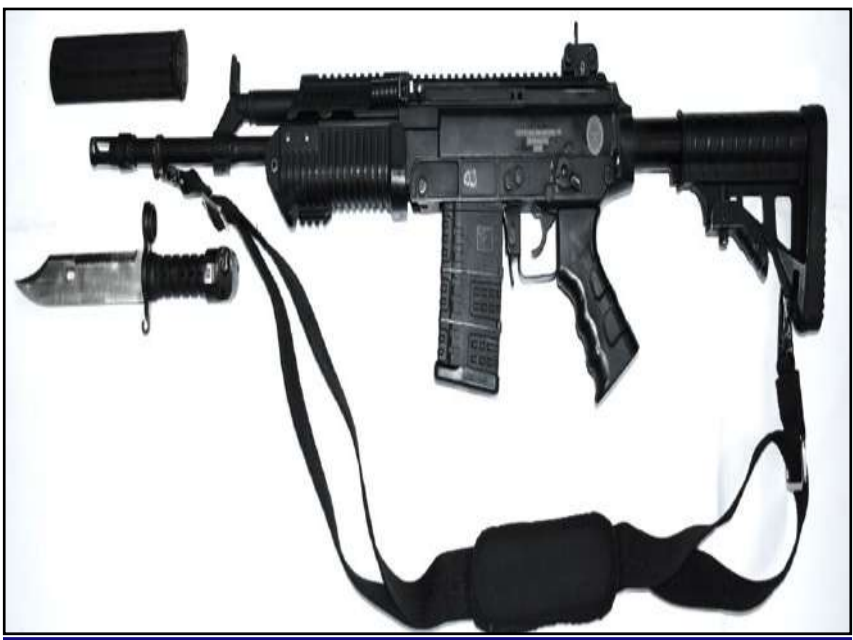
'ఉగ్రం' రైఫిల్ కు కేంద్రం పచ్చజెండా హైదరాబాద్ స్టార్టప్ ఘనత

ప్రచురణ : జగిత్యాల సంపుటి : 05 సంచిక : 327 పేజీలు : 04 వెల రూ. 2 మంగళవారం 07 - 07 - 2026