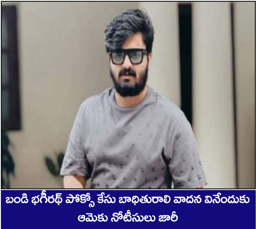
బండి భగీరథ్ పాకిస్థాన్ కేసు బాధితురాలి వాదన వినేందుకు ఆమెకు నోటీసులు జారీ

ప్రచురణ : జగిత్యాల సంపుటి : 05 సంచిక : 323 పేజీలు : 04 వెల రూ. 2 గురువారం 02 - 07 - 2026