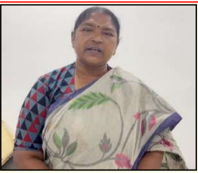
హైదరాబాద్ : వీటి జీ రామ్ జీ పథకం 60:40 నిధుల విధానంపై తెలంగాణకు తీవ్ర - మిగతా 2 లో

వీటి జీ రామ్ జీ పథకంపై కేంద్రానికి అభ్యంతరాలను తెలియజేసిన సీతక్క ● జాతీయ గ్రామీణాభివృద్ధి సదస్సులో పాల్గొన్న సీతక్క ● కొత్త పథకం ప్రవేశపెడితే మొత్తం ఆర్థిక భారం రాష్ట్రంపైనే పడుతుందని వ్యాఖ్య ● సీఎం ఆవాస్ యోజన కింద తక్షణమే గృహాలను మంజూరు చేయాలని విన్నవించింది