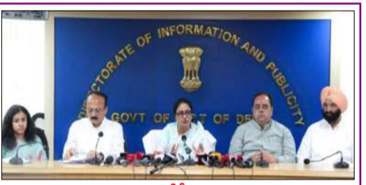
ఢిల్లీ : దేశ రాజధాని ఢిల్లీలో కాలుష్యాన్ని తగ్గించి, ఎలక్ట్రిక్ వాహనాల వినియోగాన్ని ప్రోత్సహించే దిశగా బీజేపీ ప్రభుత్వం కీలక నిర్ణయం తీసుకుంది. 'ఢిల్లీ ఈ ఏప్రిల్ 2026'కు తమ కేబినెట్ ఆమోదం తెలిపిన ముఖ్యమంత్రి రేఖా గుప్తా సోమవారం ప్రకటించారు. ఈ కొత్త విధానం - మిగతా 2 లో

ఢిల్లీని కాలుష్య రహిత రాజధానిగా మార్చడమే ప్రధాన లక్ష్యం ● 'ఢిల్లీ ఈ ఏప్రిల్ 2026'కు ఢిల్లీ కేబినెట్ ఆమోదం ● వినయోగదారులకు రూ. 15,000 కోట్ల మేర ప్రయోజనాలు కల్పన ● ఎలక్ట్రిక్ వాహనాలకు 100 శాతం రోడ్ ట్యూన్, రిజిస్ట్రేషన్ ఫీజు రద్దు ● జూలై 1 నుంచి కొత్త పాలిస్ అమల్లోకి వచ్చే అవకాశం