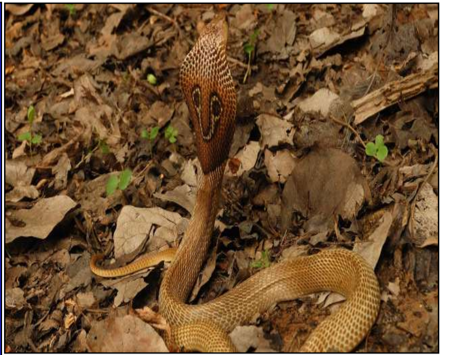
బాబోయ్ పాములు.. హైదరాబాద్ లో పెరిగిన విషసర్పాల బెడద!

ప్రచురణ : జగిత్యాల సంపుటి : 05 సంచిక : 321 పేజీలు : 04 వెల రూ. 2 మంగళవారం 30 - 06 - 2026