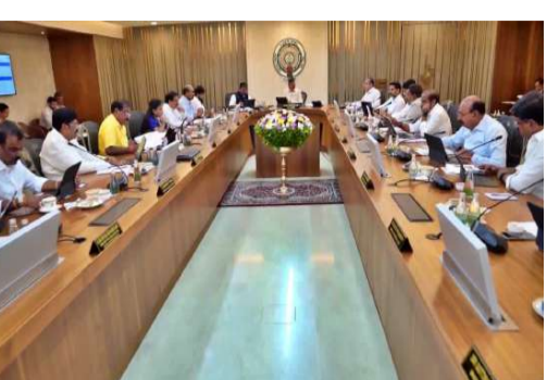
సంవత్సరం నుంచే ఇవి ప్రారంభం కానున్నాయి.అమరావతి ల్యాండ్ పూరింగ్ స్కీమ్ ఒకటి, రెండో దశల కోసం సీఆర్‌డీ డిప్యూటీ కలెక్టర్లు, తహసీల్దార్లకు సంబంధించి 95 తాత్కాలిక పోస్టుల సంబంధించి కేబినెట్ ఆమోదం లభించింది. మచిలీపట్నం, రామాయపట్నం పోస్టుల పరిధిని 15 కిలోమీటర్లకు పాటుపెంచినట్లు నిర్ణయం తీసుకుంది.