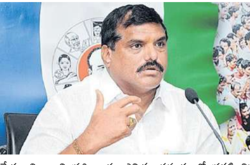
చేయదానికా అని ప్రశ్నించారు. ఎన్నికల సమయంలో ప్రకటించిన

మొదటిపేజీ తరువాయి - విమర్శించారు. విశాఖపట్టణంలో మీడియాతో మాట్లాడిన ఆయన, ప్రజలకు ఇచ్చిన హామీలను ప్రభుత్వం అమలు చేయడంలో పూర్తిగా విఫలమైందని ఆరోపించారు. నిత్యావసర వస్తువుల ధరలు భారీగా పెరగడంతో సామాన్య ప్రజలు తీవ్ర ఇబ్బందులు ఎదుర్కొంటున్నారని బొత్తు పేర్కొన్నారు. రైతులకు తమ పంటలకు గిట్టుబాటు ధరలు లభించడం లేదని, జొన్న మామిడి పంటలకు కూడా కనీస మద్దతు ధర అందడం లేదని అన్నారు. ఆక్సా రంగం పూర్తిగా సంక్షోభంలో కూరుకుపోయిందని ఆరోపించారు. విద్యాశాఖను మంత్రి నారా లోకేశ్ కు అభివృద్ధి కోసం అప్పగించారా లేక దాన్ని నిర్దిర్తించేయదానికా అని ప్రశ్నించారు. ఎన్నికల సమయంలో ప్రకటించిన