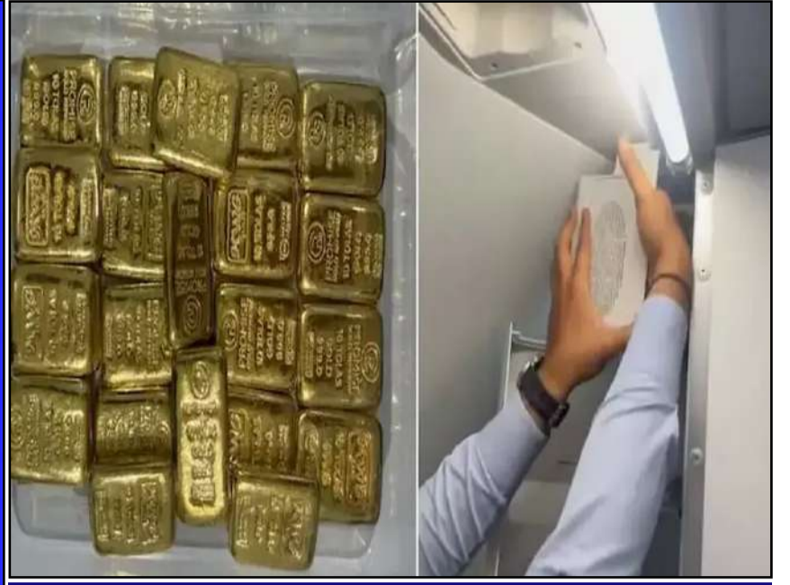
విమానంలోని టాయిలెట్ స్వీకర్ బాక్స్ లో రూ.4.26 కోట్ల బంగారం అమ్మాదాబాద్ విమానాశ్రయంలో ఈ బంగారం పట్టివేత

ప్రచురణ : జగిత్యాల సంపుటి : 05 సంచిక : 308 పేజిలు : 04 వెల రూ. 2 ఆదివారం 14 - 06 - 2026