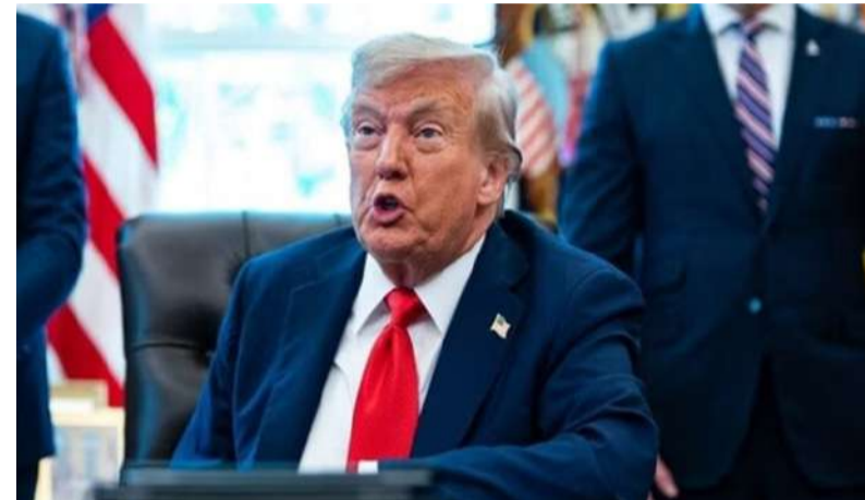
పరిణామాల ప్రభావంతో అంతర్జాతీయ మార్కెట్లలో ముడివడం ధరలు పెరగగా, స్టాక్ మార్కెట్లలో భారీ నష్టాలను చవిచూశాయి.

మొదటిపేజీ తరువాయి - ఆమెరికా, ఇరాన్ మధ్య ఉద్రిక్తతలు మరోసారి వరకాపుకు చేరాయి. చర్చల ప్రక్రియలో ఇరాన్ జాప్యం వహిస్తే భారీ మూల్యం చెల్లించుకోవాల్సి ఉంటుందని ఆమెరికా అధ్యక్షుడు డొనాల్డ్ ట్రంప్ తీవ్రంగా హెచ్చరించారు. "మిడిల్ ఈస్ట్ రోడ్ చనిపోయాడు" అంటూ ఆయన చేసిన వ్యాఖ్యలు ప్రస్తుతం సంవలనం సృష్టిస్తున్నాయి. ఇరాన్ లోని మౌలిక సదుపాయాలపై మర్సి దాడులు చేసే అవకాశం ఉందని సంకేతాలను ఆయన ఇచ్చారు. బుధవారం 'ట్రంప్ రోడ్' వేదికగా స్పందించిన ట్రంప్, "ఇరాన్ సైన్యం ప్రస్తుతం తీవ్ర అస్తవ్యస్త స్థితిలో ఉంది. వారి నౌకాదళం, వాయుసేనలు దాదాపుగా ఉనికి కోల్పోయాయి. చర్చలకు రావడంలో వారు ఇప్పటికే చాలా అలసట చేశారు, ఇప్పుడు దానికి తగిన ప్రతిఫలం అనుభవించక తప్పదు" అని పేర్కొన్నారు. ఆమెరికాకు చెందిన ఏహె-64 అపాచి హెలికాప్టర్లను కూల్చివేసిన ఘటన తర్వాత ఈ ఘర్షణ వాతావరణం నెలకొంది. దీనికి ప్రతిచర్యగా, మంగళవారం హోరూజ్ జలసంధి సమీపంలోని ఇరాన్ వాయు రక్షణ వ్యవస్థలు, దాదాపు కేంద్రాలను లక్ష్యంగా చేసుకుని ఆమెరికా దళాలు దాడులు నిర్వహించాయి. ఇది కేవలం అత్యుద్దేశ్యం కోసం చేపట్టిన చర్యలను అయిన సెంట్రల్ కమాండ్ సైన్యం చేసింది. హెలికాప్టర్ లోని ఇద్దరు సిబ్బందిని సురక్షితంగా రక్షించినట్లు వెల్లడించింది. అయితే, తమ డ్రోన్లను అమెరికా హెలికాప్టర్ డికోల్డ్ చేసి ప్రమాదం జరిగిందని ఇరాన్ వాదిస్తోంది. ఇందుకు ప్రతికారంగా బహ్రైన్, జోర్డాన్, కువైట్ లోని ఆమెరికా సైనిక స్థావరాలపై క్షిపణి దాడులు చేసినట్లు ఇరాన్ ప్రకటించింది. ఈ ఏడాది ఫిబ్రవరిలో ఇరాన్ అణు, సైనిక కేంద్రాలపై ఆమెరికా-ఇజ్రాయేల్ దళాలు దాడులు చేసినప్పటి నుంచి ఈ వివాదం కొనసాగుతోంది. తాజా