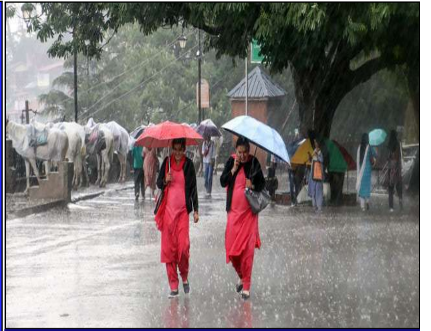
మరో రెండుమూడు రోజుల్లో తెలంగాణలోకి 'నైరుతి'

ప్రచురణ : జగిత్యాల సంపుటి : 05 సంచిక : 303 పేజిలు : 04 వెల రూ. 2 మంగళవారం 09 - 06 - 2026