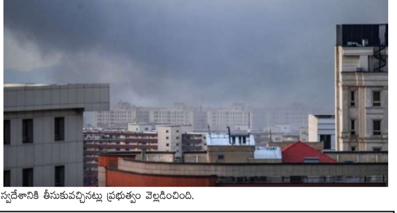
స్వదేశానికి తీసుకువచ్చినట్లు ప్రభుత్వం వెల్లడించింది.

మొదటివేళ తరువాయి - పశ్చిమాసియాలో మళ్ళీ మొదలైన క్షిపణి దాడులపై భారత్ తీవ్ర ఆందోళన వ్యక్తం చేసింది. ప్రస్తుతం అక్కడ నెలకొన్న పరిస్థితులు అంతర్జాతీయ సమాజానికి అత్యంత ఆందోళనకరంగా మారాయని కేంద్ర విదేశాంగ శాఖ సోమవారం ఓ ప్రకటనలో స్పష్టం చేసింది. ఇరు పక్షాల తక్షణమే దాడులను ఆపి, ఉద్రిక్తతలను తగ్గించుకోవాలని పిలుపునిచ్చింది. ఈ ఘర్షణలకు ఇప్పటికే 100 లోపలు దాడిపోయాయని, డి.వి.ఎల్ భారతీయ అధికారులకు ప్రజలు అపారమైన మానసిక, శారీరక క్షేదాలను అనుభవిస్తున్నారని భారత్ పేర్కొంది. ఈ యుద్ధ ప్రభావం కేవలం ఆ ప్రాంతానికే పరిమితం కాకుండా ప్రపంచ ఆర్థిక వ్యవస్థ, అంతర్జాతీయ ఇంధన సరఫరాపై తీవ్ర ప్రతికూల ప్రభావాన్ని చూపుతోందని ఆందోళన వ్యక్తం చేసింది. పౌరులకు ఎలాంటి హాని కలగకుండా చూడాలని, దౌత్యపరమైన చర్చల ద్వారా అంతిమ పరిష్కారాలను కోరింది. మరోవైపు ఉద్రిక్తతలు గరిష్ట స్థాయికి చేరడంతో ఢిల్లీలోని ఇరాన్ ఎంబి, ఇరాన్ లోని భారత్ రాయబార కార్యాలయం తమ పౌరులకు హెచ్చరికలు జారీ చేశాయి. భారతీయులు ఎవరూ ఇరాన్ ప్రాంతానికి ప్రయాణాలు చేయవద్దని సూచించాయి. ఇప్పటికే అక్కడ ఉన్న భారతీయ పౌరులు అందుబాటులో ఉన్న రవాణా సౌకర్యాల ద్వారా వీలైనంత త్వరగా ఆ దేశాన్ని విడిచి రావాలని అత్యవసర ఆద్యైజరీ ఇచ్చాయి. ఇప్పటివరకు సుమారు 2,361 మంది భారతీయులను సురక్షితంగా