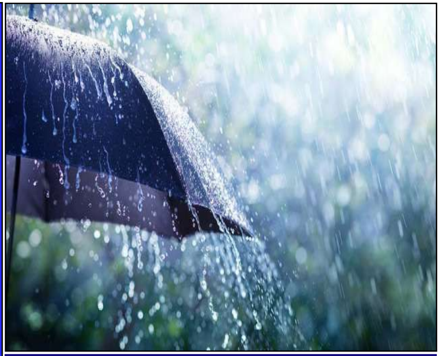
తెలంగాణకు వర్ష సూచన.. 18 జిల్లాలకు ఆరెంజ్ అలర్ట్

ప్రచురణ : జగిత్యాల సంపుటి : 05 సంచిక : 299 పేజీలు : 04 వెల రూ. 2 గురువారం 04 - 06 - 2026