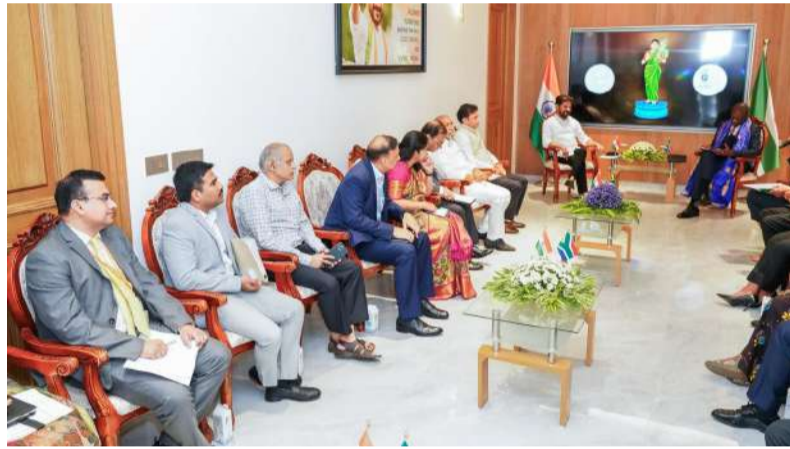
వాణిజ్య అవకాశాలపై ప్రధానంగా చర్చించారు. సమాచార సాంకేతికత (ఐటీ), ఫార్మా, గ్రీన్ ఎనర్జీ, విద్య, వైపుబ్యాఫీవర్షి, మెడికల్ టూరిజం వంటి కీలక రంగాల్లో పరస్పర సహకారంపై చర్చించారు. తెలంగాణలో పెట్టుబడులు పెట్టేందుకు ఆసక్తి చూపే దక్షిణాఫ్రికా కంపెనీలకు, పారిశ్రామికవేత్తలకు పూర్తి మద్దతు ఇస్తామని ముఖ్యమంత్రి రేవంత్ రెడ్డి హామీ ఇచ్చారు. గోబిల్ కేవలీలిటీ సెంటర్లకు (జీసీసీ) హైదరాబాద్ - మిగతా 2 లో