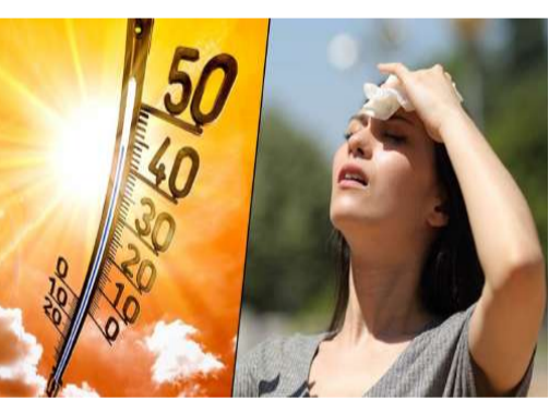
తర్వాత వాతావరణం చల్లబడుతుంది. కానీ, గాలిలో తేమ శాతం పూర్తిగా పడిపోవడంతో రాత్రిపూట కూడా వేడి సెగలు, ఉక్కుతోత

మొదటిపేజీ తరువాయి - కోల్పోయారు. వాతావరణ శాఖ రాష్ట్రంలోని 18 జిల్లాలకు రెడ్ అలర్ట్ జారీ చేయడంతో ఆందోళన వ్యక్తమవుతోంది. పగటిపూట బయటకు రావాలంటే ప్రజలు భయపడి ఇళ్లకే పరిమితమవు తున్నారు. నిన్న రాష్ట్రంలోనే అత్యధికంగా కుప్పం ధీం అసిఫాబాద్ జిల్లా సర్కార్ (డి)లో 46.5 డిగ్రీల రికార్డు స్థాయి ఉష్ణోగ్రత నమోదైంది. జగిత్యాల, కరీంనగర్, మంచిర్యాల, నిజామాబాద్, సూర్యాపేట సహా పలు జిల్లాల్లో ఉష్ణోగ్రతలు 46.4 డిగ్రీలుగా రికార్డుయ్యాయి. మొత్తంగా రాష్ట్రంలోని 16 జిల్లాల్లో పగటి ఉష్ణోగ్రతలు 46.2 నుంచి 46.5 డిగ్రీల మధ్య నమోదయ్యాయి. నిన్న ఒక్కోరోజే 244 మందిలో అతివైపున ఎండల ప్రభావం కనిపించింది. సూర్యాపేట జిల్లాలోని 22 మండలాల్లో, మంచిర్యాల, ఖమ్మం, నిజామాబాద్ జిల్లాల్లో 18 చొప్పున మండలాల్లో వడగాలులు వీచాయి. సాధారణంగా సూర్యాస్తమయం