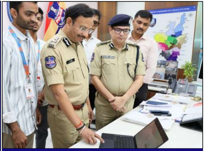
ఏఐ కాప్ రైటర్... యాప్ ను అవిష్కరించిన సజ్జనార్

ప్రచురణ : జగిత్యాల సంపుటి : 05 సంచిక : 290 పేజీలు : 04 వెల రూ. 2 ఆదివారం 24 - 05 - 2026