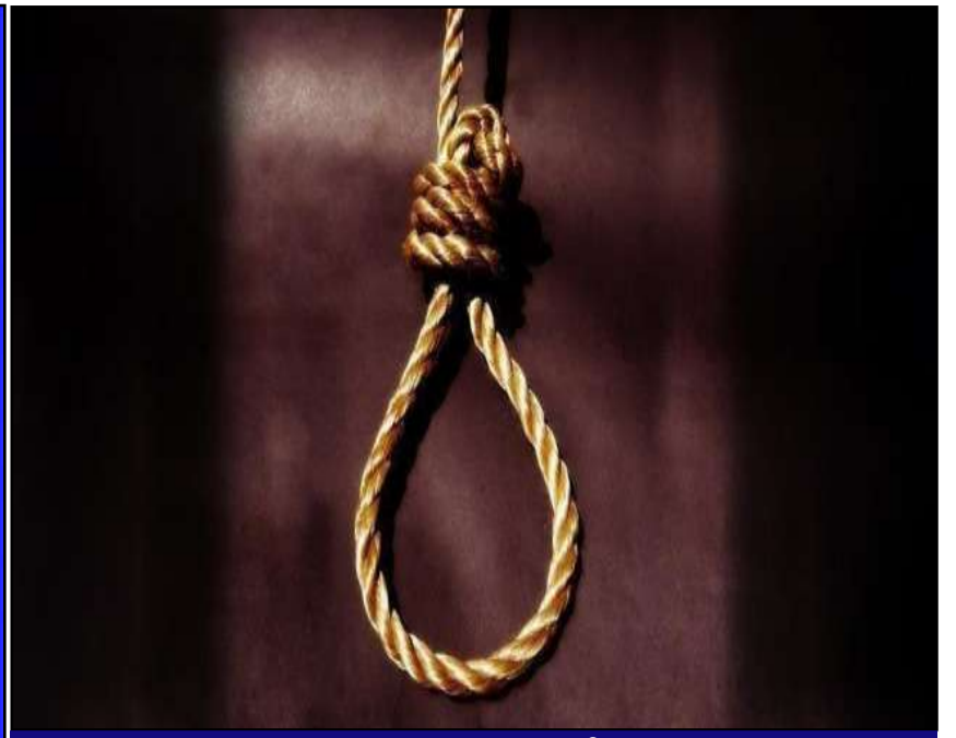
వరంగల్ జంట హత్యల కేసు.. హంతకుడు మరణించేంత వరకు ఉరి తీయాలని తీర్పు వెలువరించిన జడ్జి

ప్రచురణ : జగిత్యాల సంపుటి : 05 సంచిక : 286 పేజీలు : 04 వెల రూ. 2 గురువారం 21 - 05 - 2026