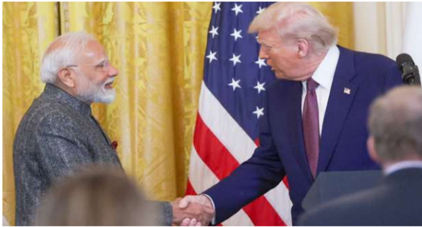
ఢిల్లీ : ప్రపంచ రాజకీయాల్లో తీవ్ర ఆసక్తి రేకెత్తించే అతికొద్ది సమావేశాల్లో భారత ప్రధాని నరేంద్ర మోదీ, అమెరికా అధ్యక్షుడు డొనాల్డ్ ట్రంప్ ల భేటీ ఒకటి. గతేడాది వారిద్దరి మధ్య తలెత్తిన విభేదాల తర్వాత ఇప్పుడు మళ్ళీ వారిద్దరూ ముఖాముఖీ కలుసుకునే అవకాశం కనిపిస్తోంది. ప్రాన్స్ లో వచ్చే నెలలో జరగనున్న జీ7 శిఖరాగ్ర సదస్సు - మిగతా 2 లో