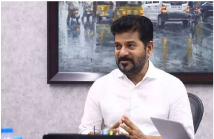
హైదరాబాద్ : తెలంగాణలో రోజురోజుకూ ముదురుతున్న ఎండల తీవ్రత, వడగాడ్లులపై ముఖ్యమంత్రి రేవంత్ రెడ్డి తీవ్ర ప్రభుత్వ యంత్రాంగాన్ని, ప్రజలను అప్రమత్తం చేశారు. ముఖ్యంగా ఉత్తర తెలంగాణ జిల్లాల్లో గరిష్ట ఉష్ణోగ్రతలు నమోదవుతున్నాయన్న వాతావరణ శాఖ హెచ్చరికల నేపథ్యంలో సీఎం స్పందించారు. జిల్లాల్లో మారుతున్న పరిస్థితులను - మిగతా 2 లో