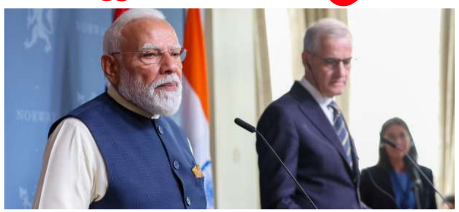
ఢిల్లీ : ప్రధాని నరేంద్ర మోదీ నార్వే పర్యటనలో ఆసక్తికర ఘటన చోటు చేసుకుంది. భారత ప్రజాస్వామ్యం, మీడియా స్వేచ్ఛ పై ప్రశ్నలు లేవనెత్తిన ఓ నార్వేజియన్ జర్నలిస్టుకు, భారత విదేశాంగ శాఖ అధికారి ఘాటుగా సమాధానం మిచ్చారు. 'ఏమైనా సమస్యలంటే కోర్టుకు వెళ్లండి' అంటూ ఆయన ఇచ్చిన జవాబు ప్రస్తుతం సోషల్ మీడియాలో వైరల్ అవుతోంది. ఐరోపా పర్యటనలో భాగంగా - మగతా 2 లో