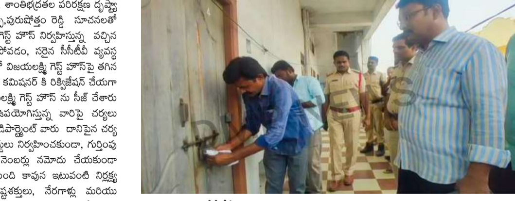
గుర్తింపు కార్డులు సీసీటీవీ కెమెరాలను ప్రభుత్వ నిబంధనల అనుసరమని సూచించారు. నిబంధనల ఉల్లంఘనల వారిపై కఠిన చర్యలు ఉంటాయని పోలీసు అధికారులు స్పష్టం చేశారు.