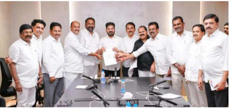
హైదరాబాద్ : ముఖ్యమంత్రి రేవంత్ రెడ్డి ఉమ్మడి మహబూబ్ నగర్ జిల్లా మండ్రులు, ఎమ్మెల్యేలతో భేటీ అయ్యారు. ఆ జిల్లా సాగునీటి ప్రాజెక్టు పనుల పురోగతిపై ఎన్సీ ఆర్ హెచ్ ఆర్ ఢిల్లో సమీక్షా సమావేశం నిర్వహించారు. పాలమూరు-రంగారెడ్డి ఎత్తిపోతల ప్రాజెక్టు భూసేకరణ ప్రక్రియను యుద్ధ ప్రాతిపదికన పూర్తి చేయాలని ఆదేశించారు. సాగునీటి ప్రాజెక్టులకు సంబంధించి - మగతా 2 లో