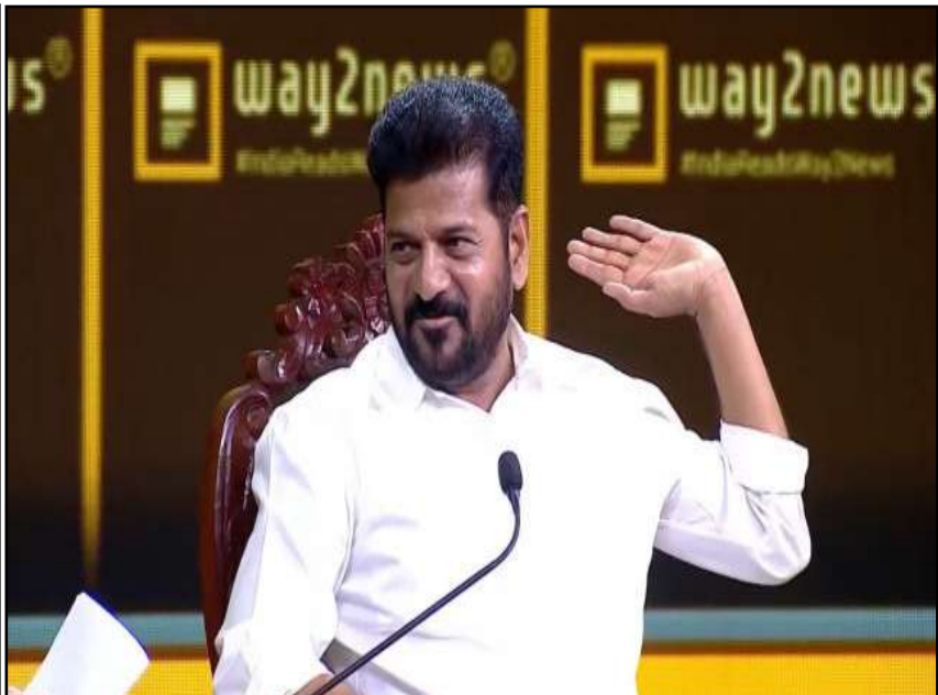
బండి సంజయ్ కిందిస్థాయి నుంచి వచ్చారు, కుమారుడి కారణంగా తలవంపులు: సీఎం రేవంత్

ప్రచురణ : జగిత్యాల సంపుటి : 05 సంచిక : 282 పేజీలు : 04 వెల రూ. 2 శనివారం 16 - 05 - 2026