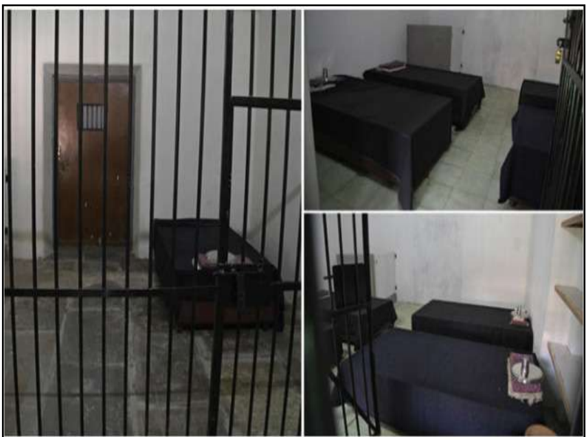
రోజుకు రూ.2 వేలు... హైదరాబాద్ జైల్లో ఒక రోజు ఖైదీగా గడిపే చాన్స్!

ప్రచురణ : జగిత్యాల సంపుటి : 05 సంచిక : 280 పేజీలు : 04 వెల రూ. 2 గురువారం 14 - 05 - 2026