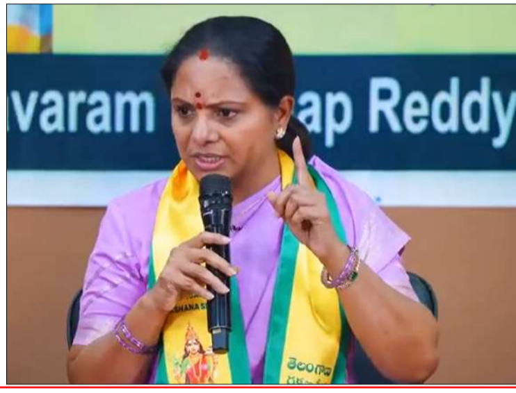
నాస్ట్రాలు సంధించారు. పోక్సో కేసులో ఉన్న బండి సంజయ్ కుమారుడు రేశం దాటి పోకుండా నోటీసులు వెంటనే లుకాట్ నోటీసులు - మిగతా 2 లో

కేంద్ర మంత్రి బండి సంజయ్ కుటుంబాన్ని లక్ష్యం చేసుకుని తెలంగాణ రక్షణ సేన చీఫ్ కవిత విమర్శ