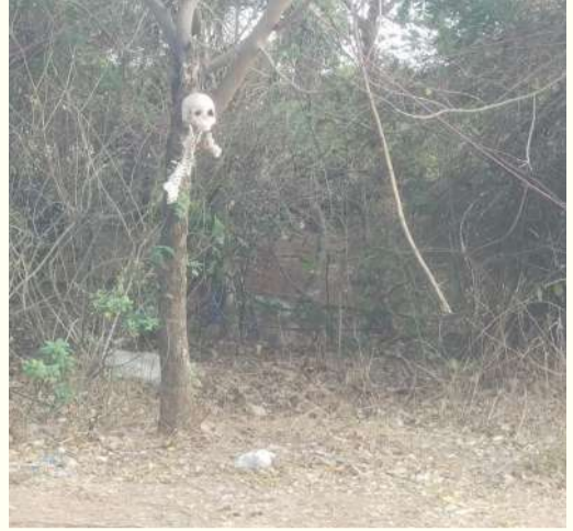
చర్యలు తీసుకోవాలని వంగర గ్రామస్థులు డిమాండ్ చేస్తున్నారు.