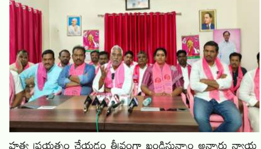
హత్య ప్రయత్నం చేయడం తీవ్రంగా ఖండిస్తున్నాం అన్నారు న్యాయ వరంగా చర్యలు తీసుకునే అవకాశం ఉంది.. ప్రతి విమర్శలు చేసే అవకాశం ఉందా భౌతిక దాడులతో కరీంనగర్ లో బండి సంజయ్ ఉగ్రవాదాన్ని ప్రోత్సహిస్తున్నారని, మోడీ నేర్పిన పాతాలు ఇవేనా.. అని నిలదీశారు. దాడి చేసిన వారిని ప్రోత్సహిస్తున్న కేంద్ర హామ్ శాఖ సహాయ మంత్రి బండి సంజయ్యు ఏ 1 గా చేర్చి విచారణ చేపట్టాలి.. పానం తో బీ ఆర్ ఎస్ పార్టీ నీ అణచివేయని చూస్తే మీతో కాదు.. ఎవరో కాదు.. అని హెచ్చరించారు. బండి సంజయ్ పై చట్టపరంగా చర్యలు తీసుకోవాలి అని జీవన్ రెడ్డి డిమాండ్ చేశారు.