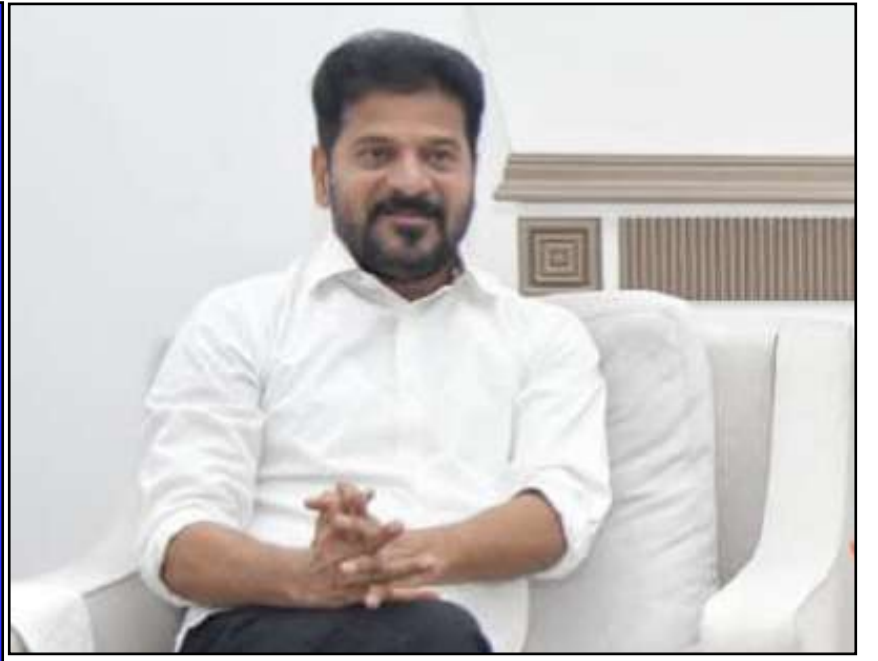
నా కాన్యా య్ కోసం ప్రజలను ఇబ్బందిపెట్టకండి డీజిపీకి సీఎం రేవంత్ రెడ్డి కీలక అదేశాలు

ప్రచురణ : జగిత్యాల సంపుటి : 05 సంచిక : 274 పేజీలు : 04 వెల రూ. 2 గురువారం 07 - 05 - 2026