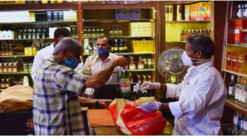
అయితే, ధరలను భారీగా పెంచితే సామాన్యుల నుంచి వ్యతిరేకత వస్తుంది, గ్రామాల్లో అక్రమ గురుదా తయారీ పెరిగే ప్రమాదం ఉందని అధికారులు భావిస్తున్నారు. అందుకే, మధ్యమార్గంగా

మొదటిపేజీ తరువాయి - ఇంధన ధరలు పెరగడం, ముడిసరుకుల రహజా ఖర్చులు, బాల్కీ తయారీకి వినియోగించే గ్యాస్ ధరలు పెరగడమే ఇందుకు ప్రధాన కారణం. గత డిసెంబర్ ప్రభుత్వం ఎన్నికల నేపథ్యంలో ఈ ప్రతిపాదనలను పక్కన పెట్టింది. అయితే, ఆదాయ వనరులను పెంచుకోవడంతో పాటు కంపెనీల విజ్ఞప్తులను పరిగణనలోకి తీసుకున్న ప్రస్తుత కాంగ్రెస్ ప్రభుత్వం ధరల పెంపునకు సానుకూలంగా ఉన్నట్లు సమాచారం. ఈ నేపథ్యంలో ధరల నిర్ధారణ ప్రక్రియను పద్దవేగించేందుకు ఎక్సైజ్ శాఖ ముగ్గురు సభ్యులతో ఒక కమిటీని ఏర్పాటు చేసింది. ఈ కమిటీ వచ్చే వారం తొలిసారి సమావేశమై, వివిధ క్రాండ్ల ధరల పెంపుపై కంపెనీలు సమర్పించిన ప్రతిపాదనలను క్షుణ్ణంగా పరిశీలించనుంది.