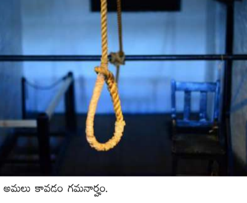
అమలు కావడం గమనార్హం.