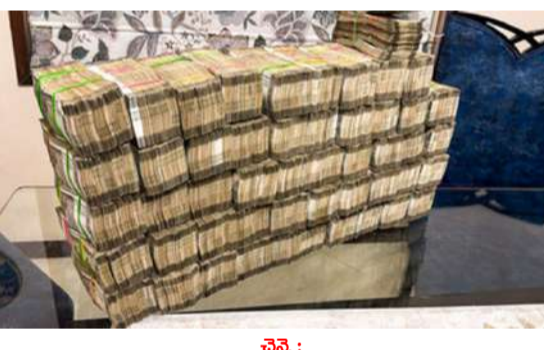
చెన్నై : తమిళనాడు అసెంబ్లీ ఎన్నికల పోలింగ్ కు ఇంకా కొన్ని రోజులే సమయం ఉండటంతో ఎన్నికల అధికారులు తనిఖీలను తీవ్రతరం చేశారు. ఏప్రిల్ 23న జరగనున్న పోలింగ్ కు ముందు - మిగతా 2 లో