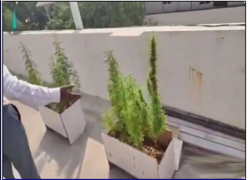
గంజాయి కొనడానికి డబ్బులేక... హైదరాబాదులో ఇంటిపైన గంజాయి పెంచుతున్న టెక్నీ

ప్రచురణ : జగిత్యాల సంపుటి : 05 సంచిక : 262 పేజీలు : 04 వెల రూ. 2 బుధవారం 22 - 04 - 2026