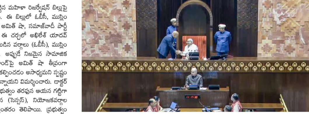
కాగా, ఓ.బీ.సి, ముస్లిం మహిళలకు ప్రత్యేక కోటా లేకపోవడమే ప్రస్తుత వివాదానికి కేంద్ర బిందువుగా మారింది.

మొదటిపేజీ తరువాయి - కేంద్ర ప్రభుత్వం ప్రతిష్టాత్మకంగా ప్రవేశపెట్టిన మహిళా రిజర్వేషన్ బిల్లుపై (నార్ జి కే పందెం అధినయం) పార్లమెంట్ లో వాదనలు చేపట్టి జరిగింది. ఈ బిల్లులో ఓ.బీ.సి, ముస్లిం మహిళలకు ప్రత్యేక కోటా కల్పించాలన్న డిమాండ్ పై కేంద్ర హోంమంత్రి అమిత్ షా, సుమతీవాది పార్టీ నేత అఖిలేశ్ యాదవ్ మధ్య తీవ్ర వాదనలు జరిగాయి. ఈ చర్చలో అఖిలేశ్ యాదవ్ మాట్లాడుతూ.. మహిళలకు కేటాయించిన 33 శాతం రిజర్వేషన్లలో వెనకబడిన వర్గాలు (ఓ.బీ.సి), ముస్లిం మహిళలకు ప్రత్యేకంగా ఉప-కోటా కేటాయించాలని డిమాండ్ చేశారు. అప్పడే నిజమైన సామాజిక న్యాయం సాధ్యమవుతుందని అయిన అభిప్రాయపడ్డారు. అఖిలేశ్ డిమాండ్ పై అమిత్ షా తీవ్రంగా స్పందించారు. భారత రాజ్యాంగం ప్రకారం మత ప్రాతిపదికన రిజర్వేషన్లు కల్పించడం అసాధ్యమని స్పష్టం చేశారు. కేవలం రాజకీయ లబ్ధి కోసమే వివక్షలు ఇలాంటి డిమాండ్ చేస్తున్నాయని విమర్శించారు. డాక్టర్ టీఆర్ కేపెర్కర్ రచించిన రాజ్యాంగ సూక్ష్మీకరణ ఇది పూర్తిగా విరుద్ధమని ప్రభుత్వం తరపున అయిన గట్టిగా వాదించారు. ఈ బిల్లును వెంటనే అమలు చేయకుండా జనాభా గణన (సెన్సస్), నియోజకవర్గాల పునర్విభజన తర్వాత అమలు చేస్తామని చెప్పడంపై మహిళా అభ్యంతరం తెలిపాయి. ప్రభుత్వం కావాలనే కాలయాపన చేస్తోందని అఖిలేశ్ అందవనోతో పాటు ఇతర ప్రతిపక్ష నేతలు ఆరోపించారు. లోక్ సభ, రాష్ట్రాల అసెంబ్లీలలో మహిళలకు 33 శాతం సీట్లు కేటాయించడం ఈ బిల్లు ముఖ్య ఉద్దేశం