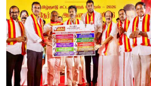
ప్రాంతాధిపతి విజయ్ ప్రకటించారు. ఆర్థికంగా, 2036 నాటికి తమిళనాడును 1.5 ట్రిలియన్ డాలర్ల ఆర్థిక వ్యవస్థగా తీర్చిదిద్దడమే లక్ష్యంగా పెట్టుకున్నామని, సూక్ష్మ, చిన్న, మధ్య తరహా పరిశ్రమల కోసం రూ.15,000 కోట్లతో భద్రతా నిధిని ఏర్పాటు చేస్తామని తెలిపారు. ఈ మేనిఫెస్టో ద్వారా సంక్షేమ పథకాలను, టెక్నాలజీ అధారిత అభివృద్ధిని జోడించి ఏప్రిల్ 23న జరగనున్న అసెంబ్లీ ఎన్నికలకు డీవీకే సిద్ధమవుతోంది.

భూముల్లో అర్హులైన వారికి ఉచితంగా ఇంటి పట్టాలు ఇస్తామన్నారు. ఆరోగ్య రంగంలో ఉచిత వైద్య పరీక్షలు, తక్కువ ధరలకే మందులు, క్యాన్సర్ బాధితుల కోసం ప్రత్యేక టిమా సౌకర్యం కల్పిస్తామని డీవీకే హామీ ఇచ్చింది. ప్రాథమిక సేవలకు అత్యంత ప్రాధాన్యమిస్తూ, ప్రతి ఇంటికి 200 యూనిట్ల వరకు ఉచిత విద్యుత్, ఇంటింటికి కూరగాయల ద్వారా తాగునీరు, ఏడాదికి ఆరు గ్యాస్ సిలిండర్లను ఉచితంగా పంపిణీ చేస్తామని ప్రకటించారు. రైతులకు అందగా నిలుస్తూ, బడు ఎకరాల కంటే ఎక్కువ భూమి ఉన్న రైతుల రుణాల్లో 50 శాతం మాఫీ చేస్తామని, సౌరశక్తి ప్రాజెక్టులను ప్రోత్సహిస్తామని మేనిఫెస్టోలో పాదుపరిచారు. మళ్ళీకూరులకు కనీసం మద్దతు ధర, చేపల వేల లేని సమయంలో రూ.27,000 ఆర్థిక సహాయం, రూ.25 లక్షల టిమా కవచేత కల్పిస్తామన్నారు. ఉద్యోగుల సంక్షేమానికి సంబంధించి అంగన్ వాడీ సిబ్బందికి రూ.18,000, పారిశుధ్య కార్యకర్తలకు రూ.10,000 వేతనం, దీర్ఘకాలం సేవలందిస్తున్న ప్రభుత్వ ఉద్యోగులకు రూ.15 లక్షల ప్రయోజనం కల్పిస్తామని హామీ ఇచ్చారు. రాష్ట్రంలో శాంతిభద్రతలకు ప్రాధాన్యత ఇస్తూ, "డ్రగ్-ఫ్రీ కేవలకాదు" కార్యక్రమాన్ని