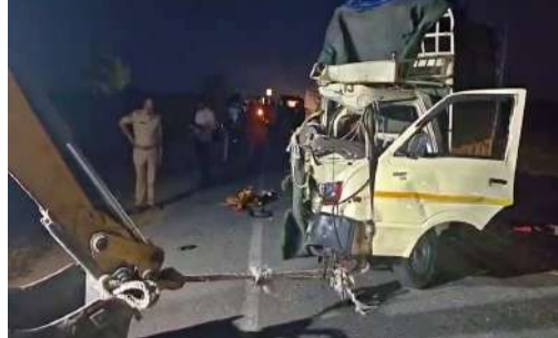
వాహనం, ఎదురుగా వస్తున్న ట్యాంకర్ ను ఢీకొట్టింది. ఈ ఘటనలో

మొదటిపేజీ తరువాయి - కర్నూలు జిల్లాలోని మంత్రాలయం సమీపంలో జరిగిన ఘోర రోడ్డు ప్రమాద ఘటనపై ప్రధానమంత్రి సరేంద్ర మోదీ తీవ్ర దిగ్భ్రాంతి వ్యక్తం చేశారు. ఈ దుర్ఘటనలో మరణించిన వారి కుటుంబాలకు, గాయపడిన వారికి ప్రధానమంత్రి జాతీయ సహాయ నిధి (సీఎంఎస్ఆర్ఎఫ్) నుంచి నష్టపరిహారం ప్రకటించారు. మృతుల కుటుంబాలకు రూ. 2 లక్షలు, గాయపడిన వారికి రూ.50 వేలు చొప్పున ఆర్థిక సాయం అందించనున్నట్లు ప్రధాని కార్యాలయం వెల్లడించింది. గురువారం తెల్లవారుజామున మంత్రాలయం మండలం బెలకలడోన సమీపంలో ఈ ప్రమాదం జరిగింది. శ్రీ రాఘవేంద్ర స్వామి వారిని దర్శించుకునేందుకు కర్ణాటకలోని చిక్మంగళూరు నుంచి యాత్రికులతో వస్తున్న బోటలో