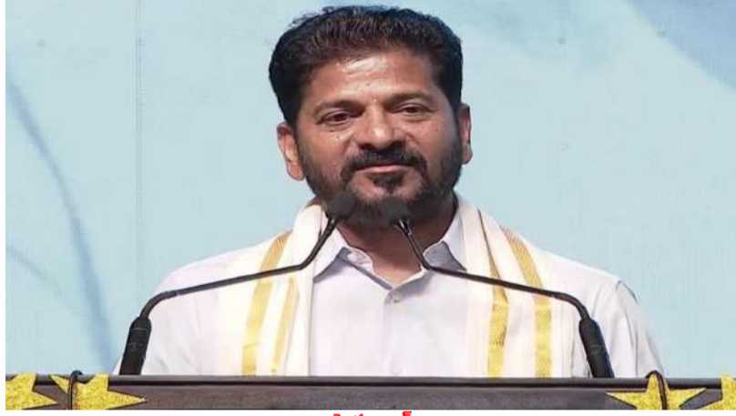
హైదరాబాద్ : మహిళా రిజర్వేషన్లు, నియోజకవర్గాల పునర్విభజన అనేవి రేచ ప్రజలందరికీ సంబంధించిన అంశాలని సీఎం రేవంత్ రెడ్డి తెలిపారు. కానీ, బీజేపీ మాత్రం తమ సొంత వ్యవహారం అన్నట్లుగా వ్యవహరిస్తోందని విమర్శించారు. మహిళా రిజర్వేషన్లు, డిలిమిటేషన్ కలిపి తీసుకురావడం, పాత జనాభా లెక్కల ప్రకారం వెళ్లడం వెనుక కుట్ర దాగి ఉందని ఆరోపించారు. ఎన్టీయే - మిగతా 2 లో