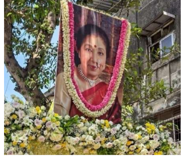
ముంబై : భారతీయ సినీ సంగీత ప్రపంచంలో ఒక శకం ముగిసింది. దిగ్గజ గాయని, స్వర సామ్రాజ్ఞి ఆశా భోంస్లే (92) వందభూతాల్లో లీనమయ్యారు. ముంబైలోని శివాజీ పార్క్ వ్యూశానవాటిలో సోమవారం సాయంత్రం ఆమె అంత్యక్రియలు పూర్తి ప్రభుత్వ లాంఛనాలతో జరిగాయి. సూర్యాస్తమయ వేళ, అశ్రునయనాల మధ్య ఆమెకు తుది వీడ్కోలు పలికారు. కుటుంబ సభ్యులు, రాజకీయ ప్రముఖులు, అభిమానుల సమక్షంలో వేద