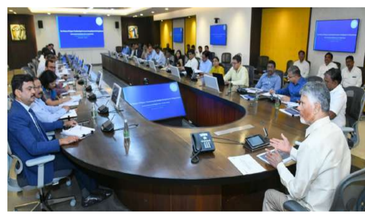
అమరావతి : ఆంధ్రప్రదేశ్ లో పారిశ్రామిక ప్రగతికి ఊతమిచ్చే దిశగా ముఖ్యమంత్రి చంద్రబాబు కీలక నిర్ణయాలు తీసుకున్నారు. పరిశ్రమల ఏర్పాటు ప్రక్రియను వేగవంతం చేసేందుకు, అనవసర నిబంధనలను తొలగించేందుకు ఉద్దేశించిన కేంద్ర ప్రభుత్వ డి-రెగ్యులేషన్ ఫేజ్-2 ప్రతిపాదనలపై సోమవారం ఆయన ఉన్నత స్థాయి సమీక్ష నిర్వహించారు. కేంద్ర ఉక్కు శాఖ కార్యదర్శి సందీప్ పొండ్రీక్ నేతృత్వంలోని ప్రతినిధి బృందంతో పాటు, రాష్ట్ర ప్రభుత్వ ప్రధాన కార్యదర్శి, ఇతర ఉన్నతాధికారులతో చంద్రబాబు సమావేశమయ్యారు. - మిగతా 2 లో