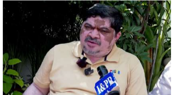
ఉద్యోగుల డీవీ 50.7 శాతం నుంచి 52.8 శాతానికి చేరింది. ఈ నిర్ణయంతో సుమారు 38 వేల మందికి పైగా ఆర్టీసీ సిబ్బందికి లబ్ధి చేకూరనుంది. డీవీ పెంపు నిర్ణయం 2026 జనవరి నుంచే అమల్లోకి వస్తుందని మంత్రి పొన్నం సృష్టం చేశారు. జనవరి నుంచి మార్చి వరకు మూడు నెలల బకాయిలను రాబోయే నెలల్లో సప్లీమెంట్ - మిగతా 2 లో