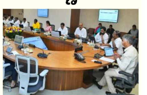
అమరావతి : ఆంధ్రప్రదేశ్ లో పారిశ్రామిక ప్రగతిని పరుగులు పెట్టించే దిశగా ముఖ్యమంత్రి చంద్రబాబు నేతృత్వంలోని రాష్ట్ర ప్రభుత్వం భారీ అడుగులు వేసింది. శుక్రవారం జరిగిన క్యాబినెట్ సమావేశంలో రాష్ట్ర సమగ్రాభివృద్ధి, యువశక్తి ఉపాధి అవకాశాల కల్పనే లక్ష్యంగా కీలక నిర్ణయాలు తీసుకుంది. సుమారు రూ. 39,436 కోట్ల విలువైన పారిశ్రామిక పెట్టుబడి ప్రతిపాదనలకు ఆమోదం తెలిపింది. నేటి క్యాబినెట్ - మిగతా 2 లో