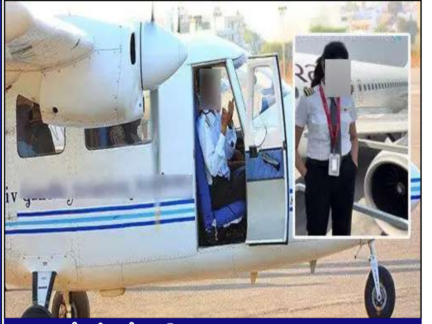
బేగంపేటలో సైలెట్ శిక్షణ విద్యార్థినిపై అత్యాచారం శిక్షణ ఇచ్చే ఉపాధ్యాయుడే విద్యార్థినిపై అఘాయిత్యం

ప్రచురణ : జగిత్యాల సంపుటి : 05 సంచిక : 251 పేజీలు : 04 వెల రూ. 2 గురువారం 09 - 04 - 2026