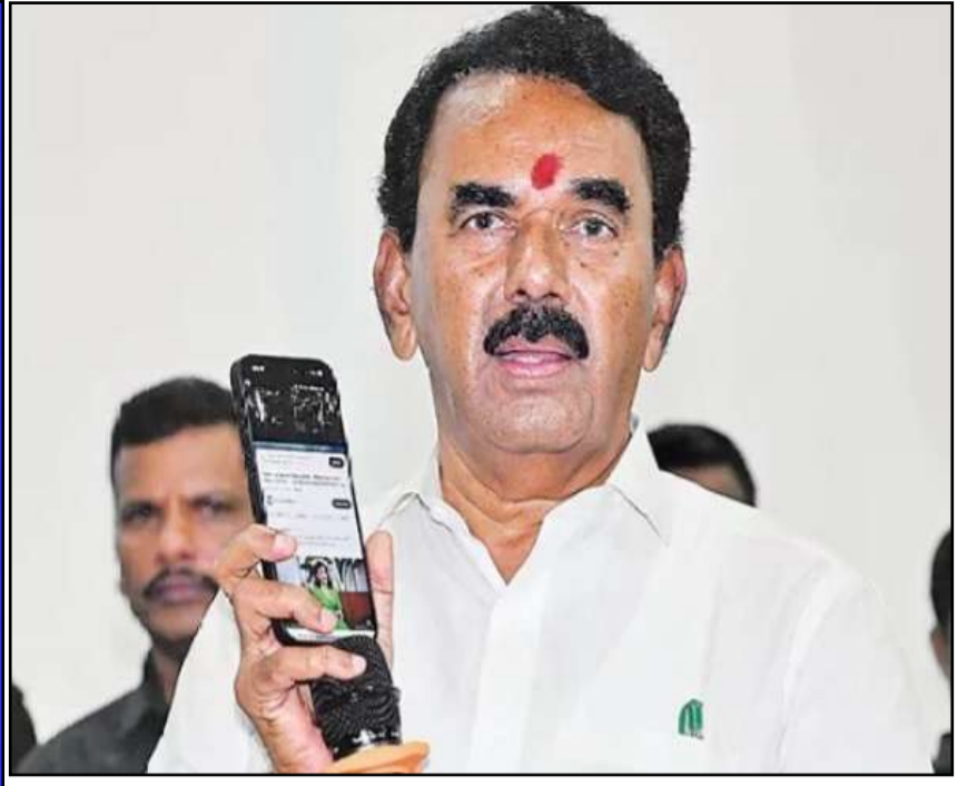
200 యూట్యూబ్ చానళ్లను బీఆర్ఎస్ కొనుగోలు చేసింది: జూపల్లి కృష్ణారావు

ప్రచురణ : జగిత్యాల సంపుటి : 05 సంచిక : 250 పేజీలు : 04 వెల రూ. 2 బుధవారం 08 - 04 - 2026