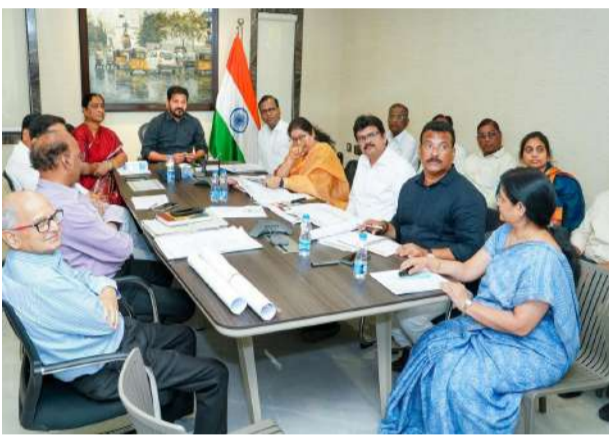
హైదరాబాద్ : బాసర ఆలయ పరిసరాల్లో ఎలాంటి రాజకీయ కార్యకలాపాలు జరగకుండా చూడాలని తెలంగాణ ముఖ్యమంత్రి రేవంత్ రెడ్డి ఆదేశించారు. ఈ నెల 6వ తేదీన రూ.225 కోట్లతో ఆలయ అభివృద్ధి పనులకు ముఖ్యమంత్రి శంకుస్థాపన చేయనున్నారు. ఈ నేపథ్యంలో, ఆలయ అభివృద్ధి మాస్టర్ ప్లాన్ ను అధికారులు ముఖ్యమంత్రి రేవంత్ రెడ్డికి వివరించారు. - మిగతా 2 లో