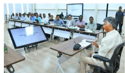
పాలంపంచుకుంటున్న మీరంతా చరిత్రలో భాగస్వాములు అవుతున్నారు. ఎన్నో ప్రాజెక్టులు చేసి ఉండొచ్చు. కానీ ఒక రాజధాని నగరాన్ని నిర్మించే అవకాశం అందరికీ దక్కుతుంది" అని అన్నారు.

మొదటిపేజీ తరువాయి - నిర్వహించారు. ప్రస్తుతం రాజధానిలో వివిధ దశల్లో ఉన్న రూ. 57,821 కోట్ల విలువైన పనుల పూర్తిగతిన ముఖ్యమంత్రి క్షణంగా సమీక్షించారు. హాసినోగ్, రోడ్లు, ట్రాన్క్ ఇన్ఫ్రాస్ట్రక్చర్, ల్యాండ్ ఘోలింగ్ స్కీమ్ మౌలిక వసతులతో పాటు అసెంబ్లీ, హైకోర్టు, సచివాలయం వంటి ఐకానిక్ భవనాల నిర్మాణంపై చర్చించారు. గత వైసీపీ ప్రభుత్వం నిలిపివేసిన పనులను తిరిగి ప్రారంభించే క్రమంలో ఎదురైన సవాళ్లను, పెరిగిన నిర్మాణ వ్యయాన్ని అధిగమించి టెండర్లు పూర్తి చేసే పనులు అమర్చించిన తీరును అధికారులు సీఎంకె వివరించారు. ప్రస్తుతం రాజధానిలో 20 వేల మంది కార్మికులు, నిపుణులు పనిచేస్తున్నట్లు తెలిపారు. ఈ సందర్భంగా చంద్రబాబు మాట్లాడుతూ... "రాజధాని నిర్మాణం అనేది కేవలం ఒక కాంట్రాక్ట్ పర్మీ కాదు. ఈ బృహత్కార్యంలో