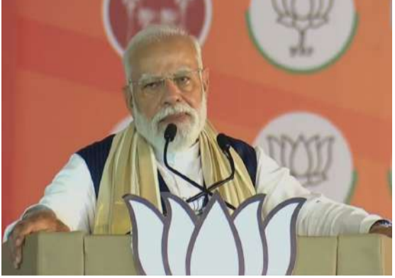
కేరళ : కేరళలో ఎల్ డీ ఏ ఫ్ ప్రభుత్వ నిర్వహణకు కౌంట్ డౌన్ ప్రారంభమైంది ప్రధాని నరేంద్ర మోదీ అన్నారు. ఎన్నికల తర్వాత కేరళలో అతిపెద్ద మార్పు జరుగుతుందని, బీజేపీ నేతృత్వంలోని ఎన్ డీ ఏ అధికారంలోకి వస్తుందని ధీమా వ్యక్తం చేశారు. కేరళ అసెంబ్లీ ఎన్నికల ప్రధానంగా భాగంగా పతనం అవుతున్న బీజేపీలో తిరువళ్లూర్ నిర్వహించిన బహిరంగ సభలో ప్రధాని మాట్లాడారు. కేరళ అభివృద్ధికి అవినీతి, మతతత్వం రెండూ అతిపెద్ద అవరోధాలని ఈ సందర్భంగా చెప్పారు. శబరి రైలు ప్రాజెక్టును ఎల్ డీ ఏ ఫ్ ప్రభుత్వం ఆలస్యం చేయడంతో తిరువళ్లూర్ ప్రజలు తీవ్రంగా - మిగతా 2 లో