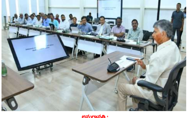
అమరావతి : అమరావతి రాజధాని నిర్మాణ పనులను వేగవంతం చేయాలని, నిర్దేశించిన గడువులోగా పూర్తి చేయాలని సీఎం చంద్రబాబు అధికారులను, నిర్మాణ సంస్థల ప్రతినిధులను ఆదేశించారు. ఈ విషయంలో రాజీ వదలే ప్రసక్తే లేదని ఆయన స్పష్టం చేశారు. తాడేపల్లిలోని క్యాంప్ కార్యాలయంలో శనివారం రాజధాని నిర్మాణ పనులపై మంత్రి నారాయణ, సీఆర్ డి, ఏడీసీ ఉన్నతాధికారులు, నిర్మాణ సంస్థల ప్రతినిధులతో ఆయన ఉన్నత స్థాయి సమీక్ష - మిగతా 2 లో