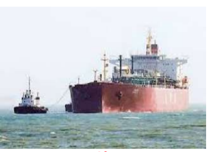
ఢిల్లీ : భారతదేశ జెండా కలిగిన గ్యాస్ కంటైనర్ 'గ్రీన్ శాన్స్', సుమారు 46,650 మెట్రిక్ టన్నుల ఎల్పీజీ గ్యాస్ తో హర్షూజ్ జలనందిని సురక్షితంగా దాటింది. ఇంతకుముందు, మార్చి 28న 47,000 మెట్రిక్ టన్నుల పెట్రోలియం గ్యాస్ తో - మిగతా 2 లో