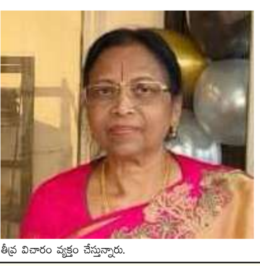
తీవ్ర వివారం వ్యక్తం చేస్తున్నారు.