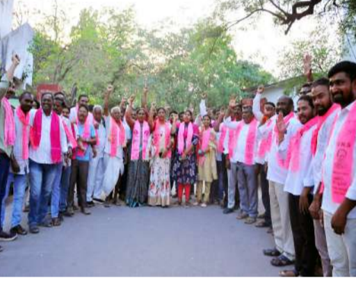
ఆర్ ఎన్ నాయకులు కార్యకర్తలు ప్రజా ప్రతినిధులు తదితరులు పాల్గొన్నారు.

డిమాండ్ చేశారు. భారత రాజ్యాంగానికి, చట్టాలకు విరుద్ధంగా ఎవరు వ్యవహరించినా దేశంలోని గౌరవ న్యాయస్థానాలు చూస్తూ ఉరుకోవని ఈ తీర్పుతో మరోసారి రుజువైందని అన్నారు. గౌరవం జలాలను పక్క రాష్ట్రానికి దోచిపెట్టి, తెలంగాణలో వ్యవసాయాన్ని సంక్షోభంలోకి నెట్టే కుట్రలను ఇంకా కొనసాగించాలని చూస్తే రేవంత్ సర్కారుకు రైతుల చేతిలో వాణులు తప్పవని హెచ్చరించారు. అది పిసి గోషు కమిషన్ కాదని పిసి కమిషన్ అని అనాడే బిజినెస్ పార్టీ చెప్పిందని ఇది ఈరోజు తేటతెల్లమైందని అన్నారు. ప్రాజెక్టుల నిర్వహణలో నిర్లక్ష్యం వహిస్తూ, రైతుల పొలాలకు నీరు అందకుండా చేస్తున్న ప్రభుత్వ వైఖరిని బిజినెస్ పార్టీ తీవ్రంగా ఖండిస్తోందని, రైతుల పక్షాన పోరాటం కొనసాగిస్తామని ఆయన ఈ సందర్భంగా స్పష్టం చేశారు. ఇప్పటికైనా చిల్లర రాజకీయాల బండ్ పెట్టి కుంగిన రెండు పిల్లలను రిపేర్ చేసి రాష్ట్ర రైతాంగానికి సాగునీరు అందించాలి అని అన్నారు. ఈ కార్యక్రమంలో పట్టణ మండల బి