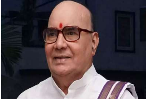
1978లో విజయవాడ తూర్పు నియోజకవర్గం నుంచి కాంగ్రెస్