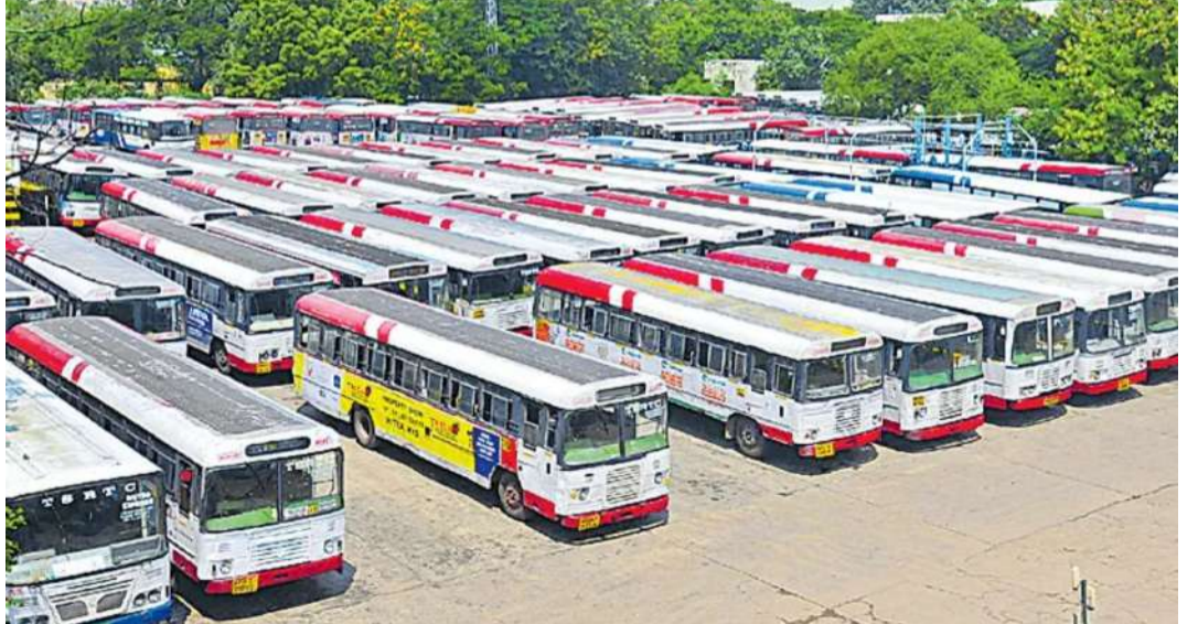
చేస్తున్నారు. అయితే, అవి ప్రయాణికుల రద్దీకి సరిపోకపోవడంతో చాలామంది ప్రైవేట్ వాహనాలను ఆశ్రయించాల్సి వస్తోంది.

మొదటిపేజీ తరువాయి - బస్సులు బయటకు రాకుండా నిలిచిపోయాయి. ఫలితంగా ఇవాళ ఉదయం నుంచే కార్యాలయాలకు, పాఠశాలలకు వెళ్లే ఉద్యోగులు, విద్యార్థులతో పాటు ఇతర ప్రయాణికులు తీవ్ర ఇబ్బందులు పడుతున్నారు. ఎన్నికల సమయంలో కాంగ్రెస్ పార్టీ తమకు ఇచ్చిన 32 హామీలను తక్షణమే అమలు చేయాలని కార్యకర్తలు ప్రధానంగా డిమాండ్ చేస్తున్నారు. హామీలు నెరవేర్చే వరకు సమ్మె విరమించేది లేదని స్పష్టం చేస్తున్నారు. రాష్ట్రంలోని అన్ని డిపోల వద్ద కార్యకర్తలు బయటపడి, ప్రభుత్వానికి వ్యతిరేకంగా నిరాచారాలు చేస్తూ తమ నిరసనను వ్యక్తం చేస్తున్నారు. ఆర్టీసీని ప్రభుత్వంలో విలీనం చేయాలనే డిమాండ్ ను కూడా బలంగా వినిపిస్తున్నారు. ఉమ్మడి ఆదిలాబాద్, మహబూబ్ నగర్, నిజామాబాద్, ఖమ్మం, నంగారెడ్డి, మెదక్ సహా అన్ని జిల్లాల్లోనూ సమ్మె ప్రభావం స్పష్టంగా కనిపిస్తోంది. ఆదిలాబాద్ రిజిస్ట్రార్ 641 బస్సులు ఆగిపోగా, ఉమ్మడి మహబూబ్ నగర్ జిల్లాలోని పది డిపోలకు చెందిన 850 బస్సులు నిలిచిపోయాయి. వేలాది మంది కార్యకర్తలు ఈ సమ్మెలో పాల్గొంటున్నారు. బస్టాండ్ ల వద్ద ప్రయాణికులు గంటల తరబడి వదిలీపాలు కాస్తున్నారు. పరిస్థితిని గమనించిన అధికారులు, ప్రయాణికుల ఇబ్బందులను తగ్గించేందుకు ప్రత్యామ్నాయ ఏర్పాట్లు చేస్తున్నారు. కాన్పిల్లో ఆర్డె బస్సులను నడిపేందుకు కనరత్తు