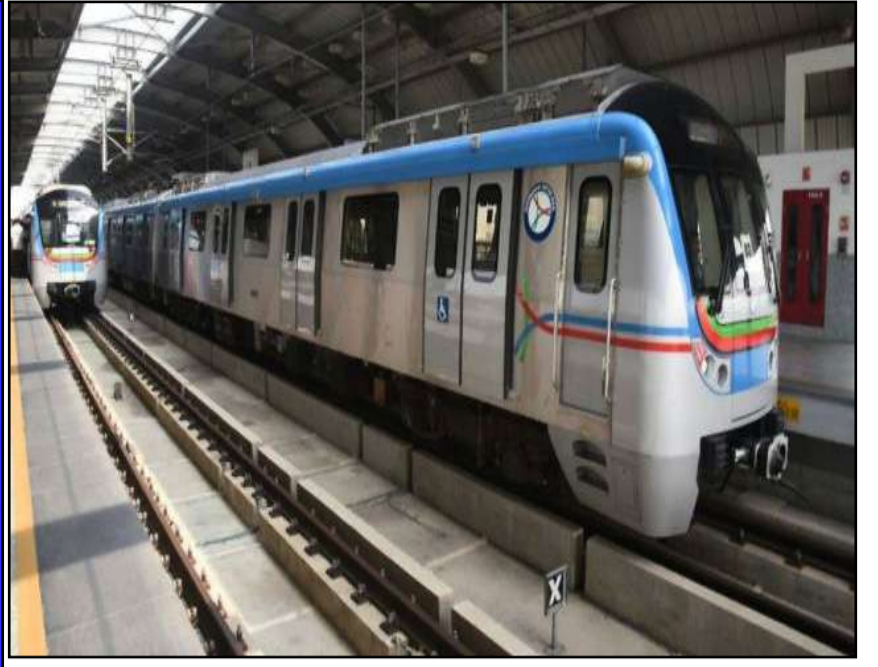
ఆర్టీసీ సమ్మె... హైదరాబాద్ మెట్రో కీలక నిర్ణయం రాత్రి 11 గంటల తర్వాత కూడా స్టాఫ్ను పాడిగించే అంశాన్ని పరిశీలిస్తున్నట్లు వెల్లడి

ప్రచురణ : జగిత్యాల సంపుటి : 05 సంచిక : 263 పేజీలు : 04 వెల రూ. 2 గురువారం 23 - 04 - 2026