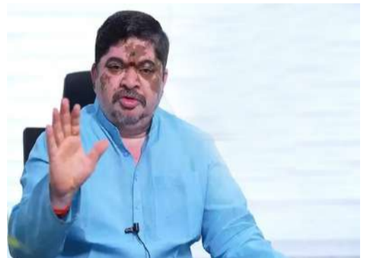
తెలిపారు. రూ.1,205 కోట్లగా ఉన్న పీఎఫ్ బకాయిలను రూ.600 కోట్లకు, రూ.690 కోట్లగా ఉన్న సీసీఎస్ బకాయిలను రూ.300 కోట్లకు తగ్గించామన్నారు. పీఎఫ్, సీసీఎస్ కోసం ప్రతి నెల రూ.75

మొదటిపేజీ తరువాయి - వారి కుటుంబసభ్యులు సమ్మెను విరమించుకోవాలని కోరారు. ఉద్యోగుల సమస్యల పరిష్కారానికి నలుగురు సీనియర్ అధికారులతో కమిటీ ఏర్పాటు చేశామని, ఇది కాలయాపన చేసే పూర్వం కాదని స్పష్టం చేశారు. ఉద్యోగులు లేవనెత్తిన 32 డిమాండ్లలో 29 అంశాలపై ప్రభుత్వానికి ఎలాంటి అభ్యంతరం లేదని, వాటిని వెంటనే పరిష్కరించవచ్చని తెలిపారు. మిగిలిన ఆర్టీసీ విలీనం, యూనియన్ గుర్తింపు వంటి అంశాలు సాంకేతిక పరమైనవని, వీటిపై లోతైన పరిశీలన అవసరమని, ముఖ్యమంత్రి, ఉపముఖ్య మంత్రితో చర్చించి నిర్ణయం తీసుకుంటామని వివరించారు. ఉద్యోగుల సంక్షేమానికి ప్రభుత్వం అనుకూలమైన పాత్రను పోషిస్తో గుర్తుచేశారు. ఆర్టీసీ విలీనం అనుకూలమైనప్పటికీ, ప్రతి నెల 1వ తేదీనే జీతాలు చెల్లిస్తున్నామని అన్నారు. దీర్ఘకాలంగా పెండింగ్ లో ఉన్న 2017 పీఆర్టీసీ పాటు బకాయిపట్ల డిలీవరెన్స్, 2013 వాటి బాధ్యతలపై తన పరిష్కరించినట్లు