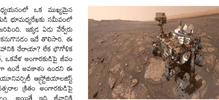
యూరోపియన్ స్పేస్ ఏజెన్సీకి చెందిన రోసలెండ్ ప్రాంక్లిన్ రోవర్ పై అందరూ పెరిగాయి. ఈ రోవర్ ఉపరితలం కింద రెండు మీటర్ల లోతు వరకు డ్రిల్ చేసి, రేడియేషన్ నుంచి మరింత సురక్షితంగా ఉన్న సమాచారాలను విశ్లేషించగలదు.