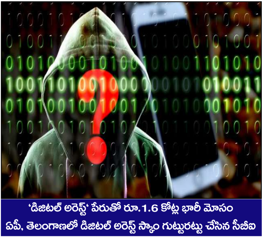
'డిజిటల్ అరెస్ట్' పేరుతో రూ.1.6 కోట్ల భారీ మోసం ఏపీ, తెలంగాణలో డిజిటల్ అరెస్ట్ స్కాం గుట్టురట్టు చేసిన సీబిఐ

ప్రచురణ : జగిత్యాల సంపుటి : 05 సంచిక : 260 పేజీలు : 04 వెల రూ. 2 ఆదివారం 19 - 04 - 2026