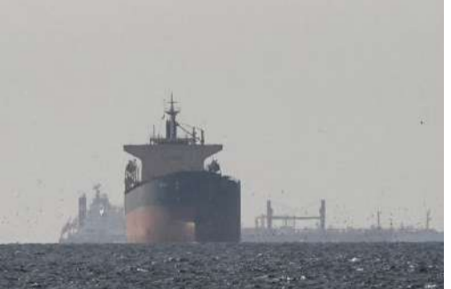
సంచలన ప్రకటన చేసింది. అమెరికా తమ నౌకలపై కొనసాగిస్తున్న దిగ్బంధనానికి ప్రతిస్పందనగా ఈ మానివేత చర్యలు తీసుకుంటున్నామని స్పష్టం చేసింది. అమెరికా ఆంక్షలు ఎత్తివేసేంత వరకు ఈ నియంత్రణ కొనసాగుతుందని ఇరాన్ అధికారిక వార్త

మొదటివేత తరువాయి - పూర్వోత్కంగా అత్యంత కీలకమైన హార్వూజ్ జలసంధిలో మరోసారి తీవ్ర ఉద్రిక్తతలు చెలరేగాయి. ఇరాన్ రివల్యూషనరీ గార్డ్స్ (ఐఆర్జీసీ) బలగాలు ఒక అయిల్ ట్యాంకర్పై కాల్పులు జరపగా, రెండు భారత ఔండా కలిగిన నౌకలు సహా పలు వాణిజ్య నౌకలు వెనక్కి మళ్లాయి. ఈ పరిణామం ప్రపంచవ్యాప్తంగా చమురు సరఫరాపై ఆందోళనలను రేకెత్తించింది. ఈ ఘటన ఒమన్కు 20 నాటికే మైగ్ దూరంలో తనివారం చోటుచేసుకున్నట్లు యాకే మార్చెట్టు ట్రేడ్ అవరేషన్స్ ధృవీకరించింది. తమ కథనం ప్రకారం, ఇరాకీకు చెందిన రెండు గవోట్లు ఎలాంటి రేడియో హెచ్చరికలు జారీ చేయకుండా ఒక ట్యాంకర్ను సమీపించి కాల్పులకు తెగబడ్డాయి. అయితే, ఈ ఘటనలో నౌకకు గానీ, సిబ్బందికి గానీ ఎలాంటి హాని జరగలేదని, అంతా సురక్షితంగా ఉన్నారని ట్యాంకర్ మాస్టర్ నివేదించినట్లు యాకే ఎంపీతో తెలిపింది. ఇదే సమయంలో, హార్వూజ్ జలసంధిపై తిరిగి తమ పూర్వస్థాయి నియంత్రణను పునరుద్ధరించినట్లు ఇరాన్