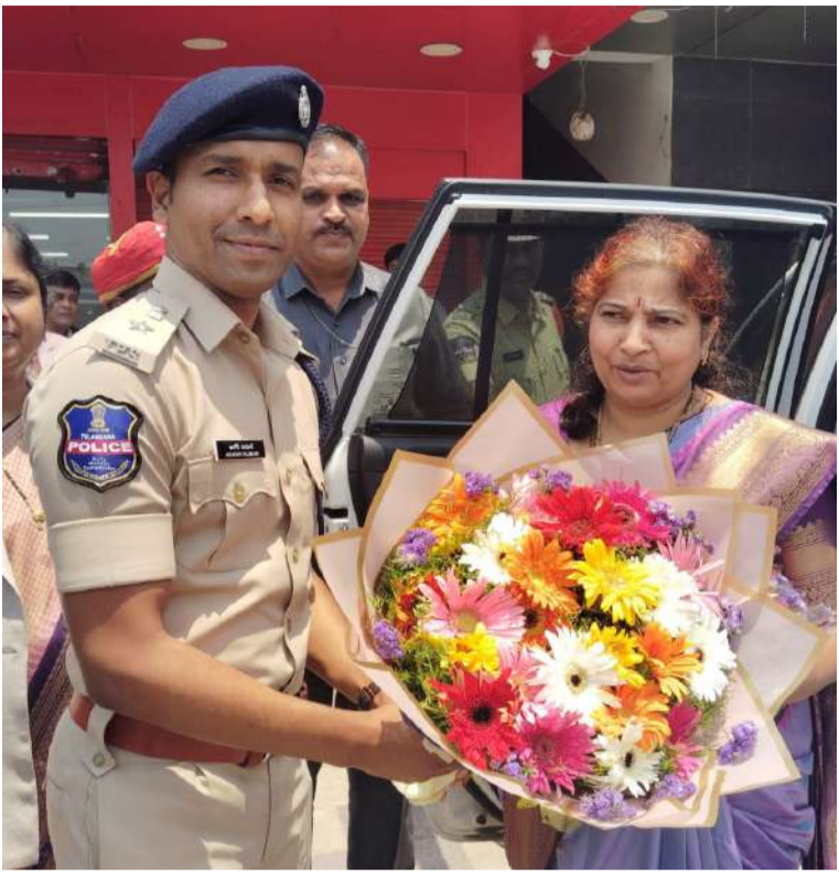
కోర్టు ఏప్రిల్ 18 (ప్రజా మంటలు): పట్టణానికి మంజూరు చేసిన అదనపు జూనియర్ సివిల్ జడ్జి & జ్యూడీషియల్ మెజిస్ట్రేట్ కోర్టును ప్రారంభించేందుకు కోర్టుకు విచ్చేసిన గౌరవ హైకోర్టు జడ్జి రేణుక యార ని జిల్లా ఎస్పీ అశోక్ కుమార్, మర్యాదపూర్వకంగా కలిసి ఫూల బొత్త ను అందజేశారు.