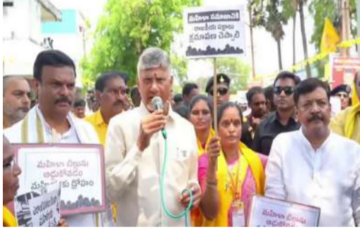
పరిస్థితి ఉండని సీఎం బాధపడ్డారు.మహిళా రిజర్వేషన్ల సవరణ బిల్లును ఓడించడం దుర్మార్గమైన చర్యని సీఎం చంద్రబాబు స్పష్టం చేశారు. అయితే దీన్ని వదిలిపెట్టే సమస్య లేదని, విపక్షాలకు

మొదటివేత తరువాయి - రాష్ట్రాలకు అన్యాయం జరగదని కేంద్రం స్పష్టం ఇచ్చిందన్నారు. మహిళల రిజర్వేషన్ల కోసం మూడు దశాబ్దాలుగా పోరాడుతున్నామని గుర్తు చేశారు. పోరాడి సాధించుకునే సమయంలో అడ్డుకోవడం క్షమించరాని నేరమని ఆగ్రహం వ్యక్తం చేశారు. విపక్ష పార్టీలు ఎన్నికల్లో ఏ ముఖం పెట్టుకుని ఓట్లు అడుగుతాయని విమర్శించారు. అడవిద్వలను కేవలం ఇంటి వరకే పరిమితం చేయాలని దుర్మార్గ ఆలోచన తగదని సీఎం పిఠాతవు పలికారు.నిన్ను విద్రోహ దినం, విపక్షాల ద్రోహాన్ని ప్రతి ఇంటికి తీసుకెళ్లాలన్నారు. మహిళా సాధికారత కోసం అడ్డంకులు సృష్టించకూడదనే కర్తవ్యం విపక్షాలపై ఉండనిపేర్కొన్నారు. 2017లో అనిష్టిలో తీర్మానం చేసే వంపామని, 2029 నాటికి మహిళలకు రిజర్వేషన్ల అమలు యోచనతో కేంద్రం సహృదయంతో ముందుకొచ్చిందని తెలిపారు. ఇంకో అడవిద్వల పైకి వస్తే చూడలేని