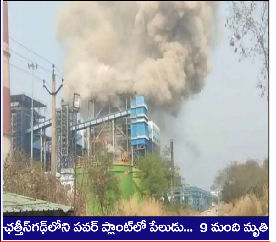
చత్తీస్ గఢ్ లోని పవర్ ప్లాంట్ లో పీలుడు... 9 మంది మృతి

ప్రచురణ : జగిత్యాల సంపుటి : 05 సంచిక : 256 పేజీలు : 04 వెల రూ. 2 బుధవారం 15 - 04 - 2026