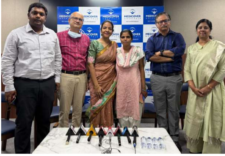
కాపాడగలిగామని వారు పేర్కొన్నారు.