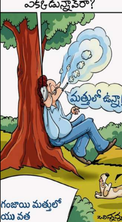
గంజాయి మత్తులో యు వత