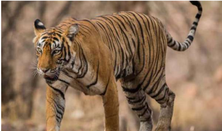
అధికారులు ప్రజలకు కీలక హెచ్చరికలు జారీ చేశారు. పశువులను మేత కోసం అటవీ ప్రాంతం వైపు గానీ, మెట్టపైకి గానీ తోలుకెళ్లవద్దని స్పష్టం చేశారు. రాత్రి సమయాల్లో ఎవరూ ఒంటరిగా బయటకు రావద్దని సూచించారు. పులి ఎక్కడైనా కనిపిస్తే వెంటనే తమకు సమాచారం అందించాలని, దానికి హాని తలపెట్టవద్దని కోరారు. ప్రస్తుతం అటవీ సిబ్బంది ఆ ప్రాంతంలో నిరంతరం గస్తీ కాస్తూ, పులి కదలికలను పర్యవేక్షిస్తున్నారు.

పెద్దపులి సంచారం తూర్పు గోదావరి జిల్లా రాజమండ్రి ప్రాంతంలోని గ్రామీణ ప్రజలను ఆందోళనకు గురి చేస్తోంది. రాజమండ్రి సమీపంలోని కోరుకొండ మండలం, కావవరం గ్రామ పరిధిలో ఉన్న పాండవుల మెట్టపై పెద్ద పులి సంచారంపై వందలకల వ్యాపించాయి. కొన్ని రోజులుగా వినిపిస్తున్న వందలకల తెరదించుతూ, అటవీశాఖ అధికారులు ఈ ప్రాంతంలో పులి ఉనికిని అధికారికంగా ప్రవీకరించారు. మెట్ట ప్రాంతంలో పులి అడుగుజాడలను గుర్తించామని, దాని కదలికలపై నిఘా ఏర్పాటు చేశామని వారు చెబుతున్నారు. అటవీశాఖ ప్రకటనతో కావవరం సహా చుట్టుపక్కల గ్రామాల ప్రజలు తీవ్ర భయాందోళనలకు గురవుతున్నారు. ముఖ్యంగా పొలాలకు వెళ్లే రైతులు, పశువుల కావరాలు బయటకు రావాలంటేనే వదిలిపోతున్నారు. చీకటి పడితే పులి గ్రామాల్లోకి ఎక్కడ ప్రవేశిస్తుందోనని ఆందోళన చెందుతున్నారు. తమకు రక్షణ కల్పించాలని వారు అధికారులను కోరుతున్నారు. ఈ నేపథ్యంలో అటవీశాఖ