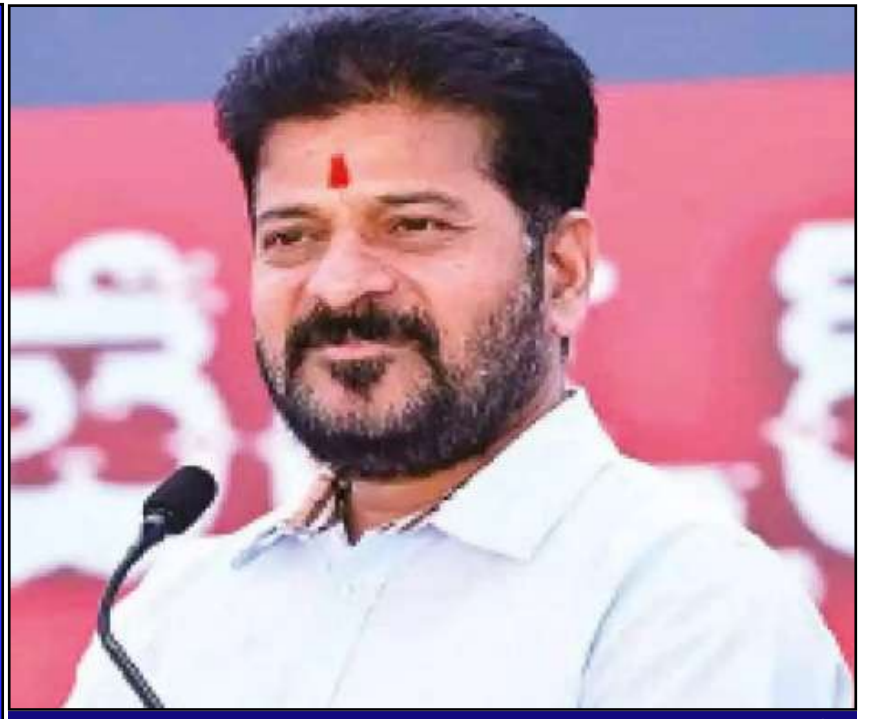
తెలంగాణ రాష్ట్ర పండుగగా వాసవీ మాత జయంతి... ఉత్తర్వులు జారీ

ప్రచురణ : జగిత్యాల సంపుటి : 05 సంచిక : 264 పేజీలు : 04 వెల రూ. 2 శుక్రవారం 24 - 04 - 2026