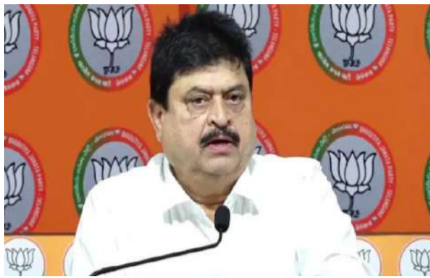
అయిన చేసే ప్రతి తప్పుడు ప్రకటనకు రామాల గాంధీ బాధ్యత ధీమా వ్యక్తం చేశారు.

మృత్యువును ఖర్చిపెట్టే రాజకీయం రాపు సిద్ధి ఖర్చి రామాల గాంధీ కనుసన్నల్లో నడుస్తున్నాడన్న రాజకీయం రాపు వయసు రీత్యా రిటైర్మెంట్ తీసుకోవడం బెటర్ అని ఎన్నోవా కాంగ్రెస్ కు ప్రజలు గుణపాఠం చెబుతారని వ్యాఖ్య