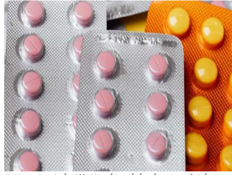
ఎవరెవరు ఉన్నారు, రాష్ట్రంలో ఎక్కడికి సరఫరా చేస్తున్నారనే కోణంలో విచారణ కొనసాగుతోంది.

హైదరాబాద్ నగరంలో సంవలసం రేపిన భారీ డ్రగ్స్ రాకెట్ను నార్కోటిక్స్ కంట్రోల్ బ్యూరో (ఎన్సీబీ) అధికారులు ఛేదించారు. మౌలాాలి పారిశ్రామిక వాడలోని ఓ కెమికల్ యూనిట్ మునుగులో అక్రమంగా డ్రగ్స్ తయారు చేస్తున్న కేంద్రాన్ని గుర్తించి మెరుపుదాడి చేశారు. ఈ ఆపరేషన్లో సుమారు రూ.17.40 కోట్ల విలువైన 69.6 కిలోల అల్పజోలామ్ అనే మత్తు పదార్థాన్ని స్వాధీనం చేసుకుని, ముగ్గురు నిందితులను అరెస్ట్ చేశారు. ఎన్సీబీ అధికారుల కథనం ప్రకారం, మౌలాాలిలోని ఓ పారిశ్రామిక యూనిట్లో డ్రగ్స్ తయారు చేస్తున్నట్లు అందిన పతాక సమాచారంతో ఈ దాడులు నిర్వహించారు. అక్కడి రెండు ఫ్లాస్కిక్ డ్రమ్ముల్లో దాని ఉందిన అల్పజోలామ్ను గుర్తించారు. వేసవిలో కల్లుకు ఉండే అధిక డిమాండ్ ను లక్ష్యంగా చేసుకుని, కల్లులో కల్చి చేసేందుకు ఈ డ్రగ్స్ ను భారీ ఎత్తున తయారు చేస్తున్నట్లు విచారణలో తెలిసింది. ఈ కల్చి కల్లు ప్రజల ఆరోగ్యంపై తీవ్ర ప్రభావం చూపుతుందని అధికారులు ఆందోళన వ్యక్తం చేశారు. అరెస్ట్ అయిన ముగ్గురిలో డ్రగ్స్ తయారీలో నైపుణ్యం ఉన్న కెమిస్ట్, ముడి పదార్థాలు సరఫరా చేసే వ్యక్తి, తయారైన డ్రగ్స్ ను స్వీకరించే వ్యక్తి ఉన్నట్లు ఎన్సీబీ అధికారులు తెలిపారు. వీరిపై ఎన్సీబీవేసిన చట్టం కింద కేసు నమోదు చేసి దర్యాప్తు చేస్తున్నారు. ఈ డ్రగ్స్ నెట్ వర్క్ వెనుక ఇంకా