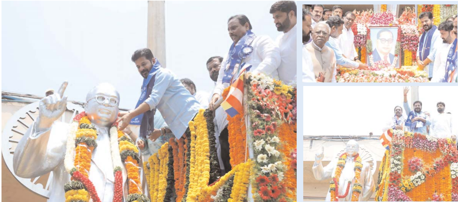
అంబేద్కర్ కు సీఎం రేవంత్ నివాళులు హైదరాబాద్ (ప్రజా మంటలు):

Published From Jagthial, Circulated to Jagthial, Jangaon, Jayashankar Bhoopalpally, Jogulamba Gwdal, Kamareddy, Karimnagar, Khammam, Komaram Bheem Asifabad, Mahabubabad, Mahabubnagar, Medak, Medchal, Nagarkurnool, Nalgonda, Nirmal, Nizamabad, Peddapalli, Rajanna Sircilla, Rangareddy, Sangareddy, Siddipet, Suryapet, Vikarabad, Wanaparthy, Warangal (Rural), Warangal (Urban), Yad