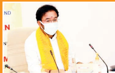
కేసీఆర్ కాబాలన్ తొందర రిజర్వేషన్లు పెంచుకునే లక్ష్యానికి ఉంది

Published From Jagtial, Circulated to Jagtial, Jangaon, Jayashankar Bhoopalpally, Jogulamba Gadwal, Kamareddy, Karimnagar, Khammam, Komaram Bheem Asifabad, Mahabubabad, Mahabubnagar, Mancheril, Medak, Medchal, Nagarkurnool, Nalgonda, Nirmal, Nizamabad, Peddapalli, Rajanna Sircilla, Rangareddy, Sangareddy, Siddipet, Suryapet, Vikarabad, Wanaparthy, Warangal (Rural), Warangal (Urban), Yadadri Bhuvanagiri.