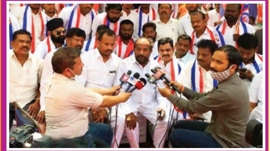
బీసీ బిల్లుకు ఉద్ఘాటన మిలిటెంట్ తరఫు ఉద్ఘాటన చేస్తాం