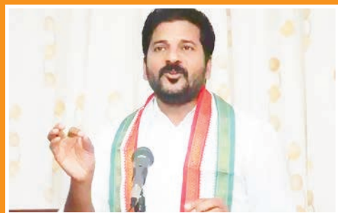
నియోజక వర్గంలో ప్రజలకు షాక్ ప్రలయంపై మండిపడ్డ రేవంత్ రెడ్డి

Published From Jagithyal, Circulated to Jagtial, Jangaon, Jayashankar Bhoopalpally, Jogulamba Gadwal, Kamareddy, Karimnagar, Khammam, Komaram Bheem Asifabad, Mahabubabad, Mahabubnagar, Mancheril, Medak, Medchal, Nagarkurnool, Nalgonda, Nirmal, Nizamabad, Peddapalli, Rajanna Sircilla, Rangareddy, Sangareddy, Siddipet, Suryapet, Vikarabad, Wanaparthy, Warangal (Rural), Warangal (Urban), Yadadri Bhuvanagiri.