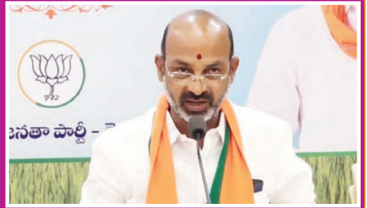
కరెంట్ ఛార్జీల పెంపు దారుణం నియోజక వర్గంలో ప్రజలపై అధిక భారం