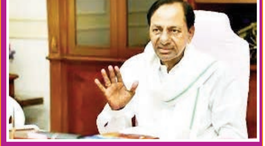
రాష్ట్ర సీఎంలను సమావేశ పర్చండి ధాన్యం సేకరణపై జాతీయ స్థాయిలో ఒక విధానం ఉండాలి