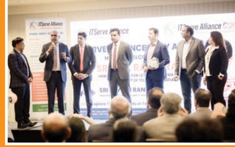
మాకు మార్ బ్రాండ్ అంబాసిడర్లు బదులు, గుంటూరు కట్టించి ఉడు రుంగం తీర్చుకోండి

Published From Jagithyal, Circulated to Jagtial, Jangaon, Jayashankar Bhoopalpally, Jogulamba Gadwal, Kamareddy, Karimnagar, Khammam, Komaram Bheem Asifabad, Mahabubabad, Mahabubnagar, Mancheril, Medak, Medchal, Nagarkurnool, Nalgonda, Nirmal, Nizamabad, Peddapalli, Rajanna Sircilla, Rangareddy, Sangareddy, Siddipet, Suryapet, Vikarabad, Wanaparthy, Warangal (Rural), Warangal (Urban), Yadadri Bhuvanagiri.