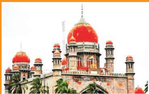
రాష్ట్రానికి 10 మంది కొత్త న్యాయమూర్తులు కేంద్ర ప్రభుత్వ సిఫారసుకు రాష్ట్రపతి ఆమోదం

Published From Jagithyal, Circulated to Jagtial, Jangaon, Jayashankar Bhoopalpally, Jogulamba Gadwal, Kamareddy, Karimnagar, Khammam, Komaram Bheem Asifabad, Mahabubabad, Mahabubnagar, Mancherial, Medak, Medchal, Nagarkurnool, Nalgonda, Nirmal, Nizamabad, Peddapalli, Rajanna Sircilla, Rangareddy, Sangareddy, Siddipet, Suryapet, Vikarabad, Wanaparthy, Warangal (Rural), Warangal (Urban), Yadadri Bhuvanagiri.