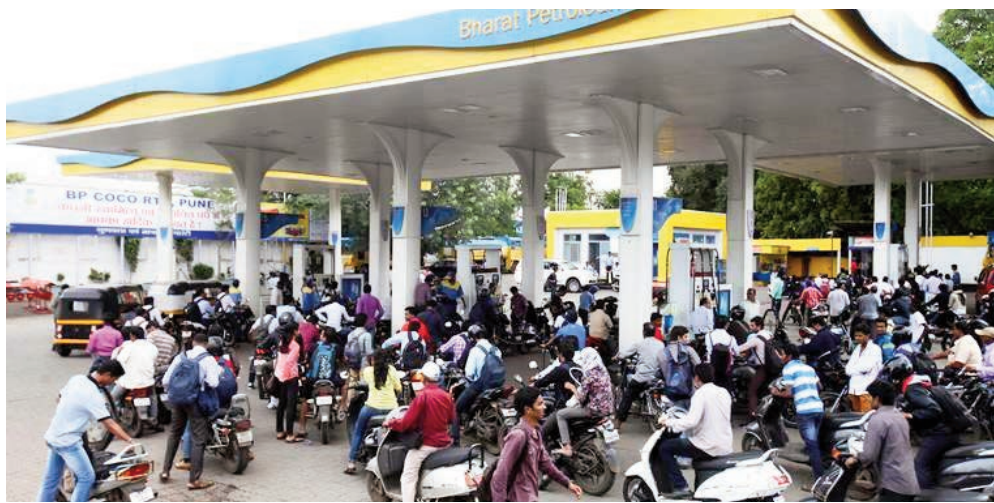
పెట్రోల్ డిజిల్ ధరల పెంపుపై కాంగ్రెస్ ఆగ్రహం మోడి అధికారం చేపట్టిన ఎక్స్ట్రా సుంకాల మోత 8 ఏళ్లలో రూ.26లక్షల కోట్లను వసూలు చేశారని ఆరోపణ మోడి తీరుపై మండిపడుతూ వివరాలు విడుదల

అనుకున్నట్లుగానే ధరల పెరుగుదల ఉక్రెయిన్ యుద్ధం కారణంగా మరింత వడ్డింపు