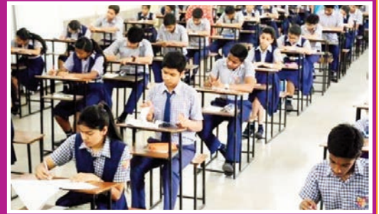
తెలంగాణ ఎంసెట్, ఈసెట్ షెడ్యూల్ విడుదల జూలైలో ఎంసెట్ నిర్వహణకు తేదీల ప్రకటన