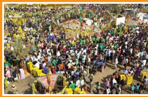
అభిమానంగా వుండింది మేదారం జాతీయ జాగ్రత్తల ముఖ్యం