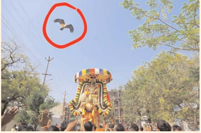
కరీంనగర్ పట్టణంలో జరుగుతున్న శ్రీ వెంకటేశ్వర స్వామి బ్రహ్మోత్సవాల్లో మాడ వీధుల్లో హనుమత్ వాహనం ఊరేగింపులో అభ్యుతం. గరుడ పక్షి స్వామి వారి రూపంలో హనుమత్ వాహనం పైన ప్రదక్షిణలు.. స్వామి వారి పచ్చి భక్తులకు ఆతీర్పణం చేశారని సంతోషం