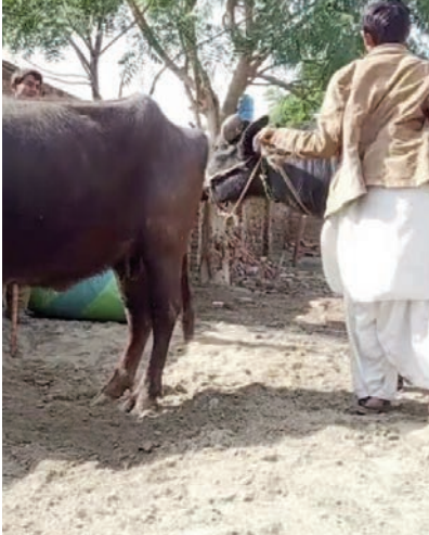
ఊర్లోని బ్రెలెలను మేపివాడు. రోజు ఉదయం సద్దైనం మూటకట్టుకొని, ఓ నల్ల గొడుగు వీపుకు తగిలించుకుని, పెద్ద స్ట్రాపిక్ బాటిలుకు గొనె పట్ట పేలిక కట్టి మొదలు తన బ్రెలెను గాటి నుంచి తీసి ఊర్లో ఒక్కొక్కటి వచ్చి చేరేవి.

ఎవరో చల్లటి మజ్జిగ చిక్కటి మజ్జిగ గ్లాసు నిండా పోసి ఇస్తున్నారు. ఒక్క గుక్క నోట్లో పోసుకోగానే ప్రాణం లేచాల్సిన స్థైర్యం గతం కళ్ళ ముందు గలుకున్న ప్రత్యక్ష ప్రైండ్. ఒకప్పుడు ఊర్లో మూడుపుటలా తినే రమణమ్మ భర్త పెళ్ళైన మూడేండ్లకే చనిపోయాడు. ఆయన బ్రతికున్నప్పుడు