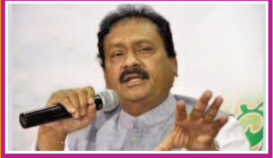
హామీలు అమలు చేయలేకపోతున్న మోడీ ప్రజలను తప్పదోస పట్టించేందుకే విభజన అంశం

Published From Jagtial, Circulated to Jagtial, Jangaon, Jayashankar Bhoopalpally, Jogulamba Gadwal, Kamareddy, Karimnagar, Khammam, Komaram Bheem Asifabad, Mahabubabad, Mahabubnagar, Mancheril, Medak, Medchal, Nagarkurnool, Nalgonda, Nirmal, Nizamabad, Peddapalli, Rajanna Sircilla, Rangareddy, Sangareddy, Siddipet, Suryapet, Vikarabad, Wanaparthy, Warangal (Rural), Warangal (Urban), Yadadri Bhuvanagiri.