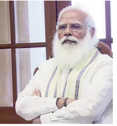
అవమానించడం వంటి అంశాలను ప్రస్తావించడం ద్వారా కాంగ్రెస్ నిర్దేశితమాలనుకోవడం కూడా సరికాదు. ఎందుకంటే ఈ తరం ప్రజలకు ఇప్పుడు ఆ

ద్దించేందుకు వచ్చిన మహాసభాపదన్న రీతిలో మోడీని సోషల్ మీడియా వేదికగా పొగగడతో ముంచెత్తే ప్రచారం మాత్రం సాగుతోంది. తాజాగా జీఎస్ టీ భయాలు వెన్నాడుతున్నా వాటిని సవరించి అడుకుంటామన్న ఒక్కమాట కూడా ప్రభుత్వం నుంచి రావడం లేదు. దీంతో ప్రజలకు మోడీ ప్రభుత్వం భరోసాగా లేదన్న విషయం అర్థం అవుతోంది. విపక్షాలు కూడా సమస్యలను చర్చించడానికి పార్లమెంట్ లో అవకాశాలు వచ్చినా వదులుకుని, గొడవలకు ప్రాధాన్యం ఇస్తున్నారు. సమస్యను సమస్యగా చర్చించడంలో కాంగ్రెస్, కమ్యూనిస్టులు పూర్తిగా విఫలమయ్యారు. పార్లమెంటులో సమస్యలను ప్రస్తావించడం కన్నా గొడవ చేసి వాయిదా వేయించడంలోనే కాలు గడుపుతున్నారు. కనీసం ఈ పార్లమెంట్ బడ్జెట్ సమావేశాల్లో అయినా దేశం, ప్రజలు ఎదుర్కొంటున్న అనేకానేక సమస్యలపై సమగ్ర చర్చకు వట్టుబట్టాలి. అందుకు అనుగుణంగా వాతావరణం సృష్టించుకోవాలి. మందిరీణులు ముందుగాయని చెప్పి అధికారంలోకి వచ్చిన సంద్రమోడీ వల్ల ప్రజలకు మంచిరీణులు పోయాయి. ప్రధాని మాట్లాడే మాత్రమే 'అవేదీన్' వస్తాయో లేదో గానీ ప్రస్తుతం పరిస్థితులు మాత్రం దేశాన్ని కలవరపెడుతున్నాయి. దుర్భరపరిస్థితులు ఎదుర్కొంటున్నారని.