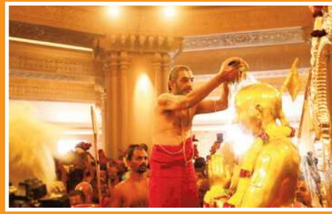
స్వర్ణ రామానుజాలకు ప్రాణప్రతిష్ఠి ముగిసిన సహస్ర్రాజ్ఞి ఉత్సవాలు