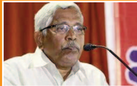
రాజ్యాంగం మార్చాలంటే మూర్ఖత్వం కేసీఆర్ ప్రకటనపై మండిపడ్డ కోదండరామ్

IPublished From Jagtial, Circulated to Jagtial, Jangaon, Jayashankar Bhoopalpally, Jogulamba Gadwal, Kamareddy, Karimnagar, Khammam, Komaram Bheem Asifabad, Mahabubabad, Mahabubnagar, Mancheril, Medak, Medchal, Nagarkurnool, Nalgonda, Nirmal, Nizamabad, Peddapalli, Rajanna Sircilla, Rangareddy, Sangareddy, Siddipet, Suryapet, Vikarabad, Wanaparthy, Warangal (Rural), Warangal (Urban), Yadadri Bhuvanagiri.