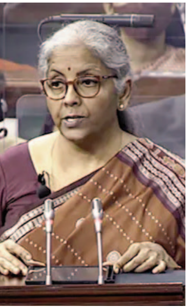
వినియోగించేవారు. ప్రధాని నరేంద్ర మోడీ

ప్రతియం మోడీ హయాంలోనూ కలగడం లేదు. 2016లో అప్పటి కేంద్ర ఆర్థిక మంత్రి అరుణ్ జైట్లీ రైల్వే బడ్జెట్ను సాధారణ బడ్జెట్లో పాటు రైల్వే బడ్జెట్ను కూడా ప్రవేశపెట్టారు. ఇకపోతే చరిత్రలోని సంప్రదాయాలను పరిశీలిస్తే 1947 నుంచి దేశ సాధారణ బడ్జెట్ను సమర్పించేందుకు ఎరువు ల్రిఫ్ కేసే