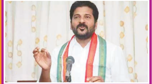
రాజ్యాంగం రద్దు బీజేపీ ఎఠెండా చీజేపీ ఎఠెండాను అమలు చేసినాలో కేసీఆర్