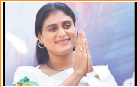
వైఎస్సార్ తెలంగాణ పార్టీకి ఈమె గుర్తింపు మూర్తిలో ప్రజాప్రస్థానం కోసం షర్లం అలోచన

Published From Jagtial, Circulated to Jagtial, Jangaon, Jayashankar Bhoopalpally, Jogulamba Gadwal, Kamareddy, Karimnagar, Khammam, Komaram Bheem Asifabad, Mahabubabad, Mahabubnagar, Mancheril, Medak, Medchal, Nagarkurnool, Nalgonda, Nirmal, Nizamabad, Peddapalli, Rajanna Sircilla, Rangareddy, Sangareddy, Siddipet, Suryapet, Vikarabad, Wanaparthy, Warangal (Rural), Warangal (Urban), Yadadri Bhuvanagiri.