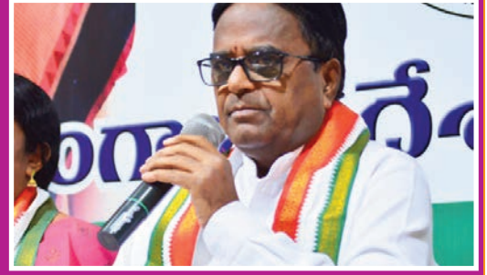
టూరిజం కోసం లక్షకొట్టు అగలేతారు మల్లన్నసాగర్ పీఠాలో డబ్బులు వ్యూహ