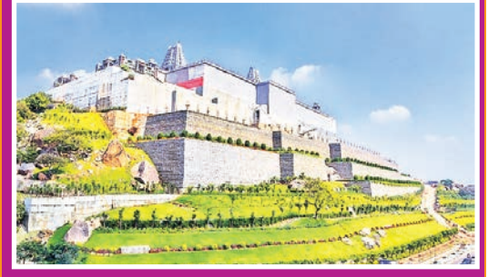
మార్చి 4 నుంచి యాదాద్రి బ్రహ్మోత్సవాలు