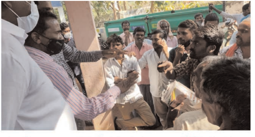
విద్యుత్ అధికారులు AE తో మాట్లాడుతున్న నవాబుపేట్ గ్రామ ప్రజలు