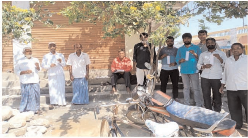
ఇందుర్తి గ్రామము లో విద్యుత్ బిల్లు చిట్టి లతో గ్రామస్థులు