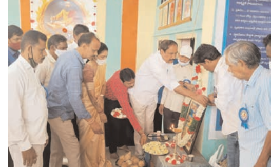
వారికిరత్, బాపూరపు చంద్రశేఖర్, సంపాంగి సాయి, తదితరులు పాల్గొన్నారు.