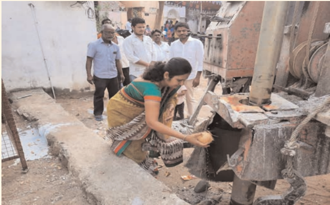
కొడిమ్యాల మండల కేంద్రంలో గ్రామసంచాయితీ ఆవరణలో సూతనంగా నిర్వహిస్తున్న గ్రంథాలయం వద్ద సూతన బోధను ప్రారంభించిన సర్పంచ్ విలేజ్ ముఠ వరసంహార్య