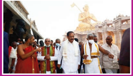
ప్రపంచంలోనే 8వ అద్భుతం నివక్షకు శాశులేని సమాజం కోసం కృషి