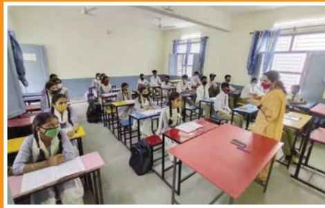
విద్యార్థుల స్కూలులో ఇంగ్లీష్ మీడియం తోధనకు అడుగుతుంటూ ఉత్తయ్యల జారీ చేసిన పాఠశాల విద్యాశాఖ

Published From Jagtial, Circulated to Jagtial, Jangaon, Jayashankar Bhoopalpally, Jogulamba Gadwal, Kamareddy, Karimnagar, Khammam, Komaram Bheem Asifabad, Mahabubabad, Mahabubnagar, Mancheril, Medak, Medchal, Nagarkurnool, Nalgonda, Nirmal, Nizamabad, Peddapalli, Rajanna Sircilla, Rangareddy, Sangareddy, Siddipet, Suryapet, Vikarabad, Wanaparthy, Warangal (Rural), Warangal (Urban), Yadadri Bhuvanagiri.