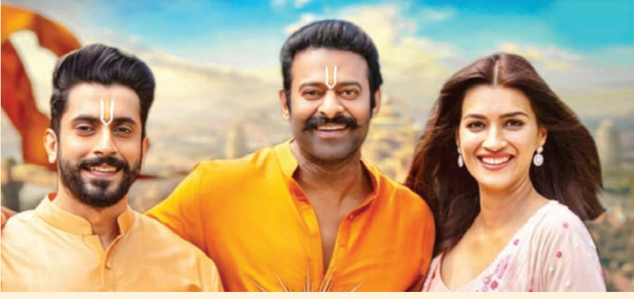
సనన్ సీత్ పాత్రలో నటించింది. రామణుడు పాత్రలో బాలీవుడ్ స్టార్ సైఫ్ అలీఖాన్ నటించాడు. ఈ చిత్రం అగస్టు 11న ప్రేక్షకులు ముందుకు రానుంది.

పాన్ ఇండియా స్టార్ ప్రభాస్ ప్రస్తుతం వరుస సినిమాలతో బిజీగా గడుపుతున్నాడు. ప్రస్తుతం ఈయన చేతిలో నాలుగు సినిమాలున్నాయి. ఈయన నటించిన రాధేశ్యామ్ విడుదలకు సిద్ధంగా ఉంది. జిల్ ఫేం రాధాకృష్ణ కుమార్ దర్శకత్వం వహించిన ఈ చిత్రంలో పూజాహెగ్డే హీరోయిన్ గా నటిస్తుంది. మర్చి 11న ఈ చిత్రం విడుదలకానుంది. ఇప్పటికే ఆదిపురుష్ చిత్రం కూడా షూటింగ్ పూర్తి చేసుకుంది. ప్రస్తుతం ఈ చిత్రం పోస్ట్ ప్రొడక్షన్ పనుల్లో బిజీగా ఉంది. ఓంకార్ ఈ చిత్రానికి దర్శకత్వం వహించాడు. తాజాగా ఈ చిత్రానికి సంబంధించిన ఓ వార్త సోషల్ మీడియాలో వైరల్ అవుతుంది. రామాయణం కథను