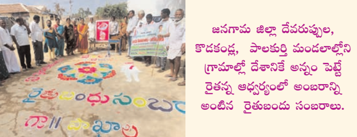
జనగామ జిల్లా దేవరపుల, కొడకపల్లి, పాలకుర్తి మండలాలలోని గ్రామాల్లో దేశానికే అన్నం పెట్టే రైతుల ఆధ్వర్యంలో అందరినీ ఆంధ్ర రైతుబంధు సందర్భాలు.