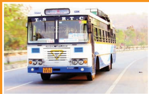
సంక్రాంతి ఆర్డీసీ అదనపు బస్సులు అదనపు ఛార్జీలు లేకుండానే ఏర్పాటు

Published From Jagitial, Circulated to Jagitial, Jangavali, Jayashankar Bhupalipally, Jogulamba Gopalwadi, Kanareddy, Kanimireddy, Khammam, Khammam Bheem Asifabad, Mahabubnagar, Mahabubnagar, Manureti, Medak, Medchal, Nagarkurnool, Nalgonda, Nirmal, Nizambad, Peddapalli, Rajanna Sircilla, Rangareddy, Sangareddy, Siddipet, Suryapet, Vikarabad, Wanaparthy, Warangal (Rural), Warangal (Urban), Yadadri Bhuvanagiri.