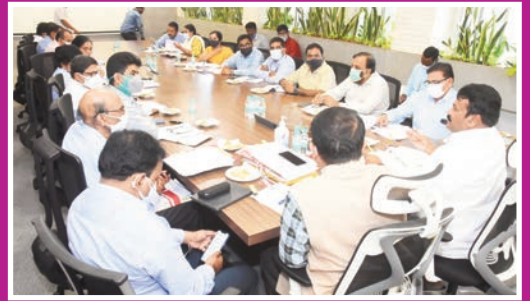
నాలా ముంపు సమస్యలకు చెక్ నాలాలకు ఇరువైపులా గోడల నిర్మాణం