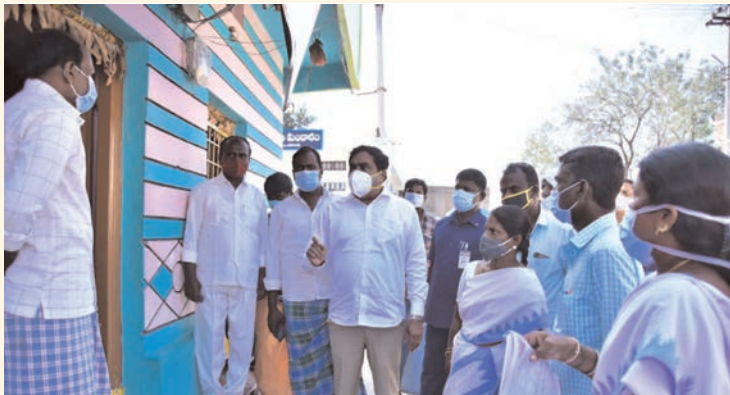
జనగామ జిల్లా లింగాల ఘనపూర్ మండలం కుందారం గ్రామంలో శనివారం ఇంటింటా జ్వర సర్వే కార్యక్రమంలో పాల్గొని గ్రామ ప్రజలకు సూచనలు చేస్తున్న రాష్ట్ర పంచాయతీరాజ్, గ్రామీణాభివృద్ధి, గ్రామీణ మంచినీటి సరఫరా శాఖ మంత్రి ఎర్రబెల్లి దయాకర్ రావు.