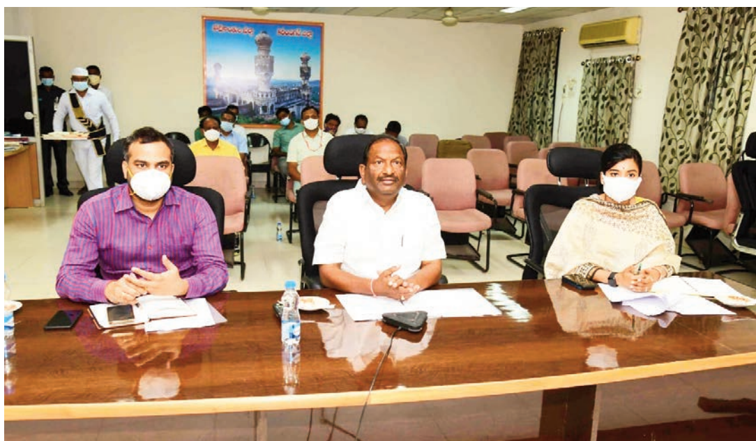
హైదరాబాద్, జనవరి 22:

దళితబంధుకు బడ్జెట్లో 25వేల కోట్లు: మంత్రి హరీష్ రావు