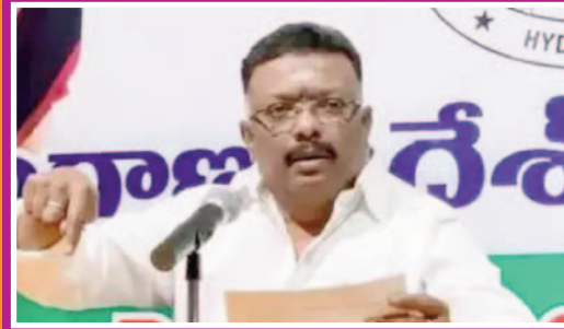
ధరణి బాధితులకు అందగా కాంగ్రెస్ వారం రోజుల పాటు ధూ వరిరక్షణ ఉద్యమం