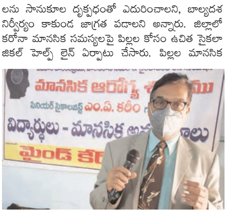
లను సానుకూల దృక్పథంతో ఎదురించాలని, బాల్యరక నిర్దిష్టం కాకుండా జాగ్రత్త పడాలని అన్నారు. జిల్లాలో కరోనా మానసిక సమస్యలపై పిల్లల కోసం ఉచిత సైకలాజికల్ హెల్ప్ లైన్ ఏర్పాటు చేసారు. పిల్లల మానసిక