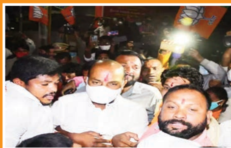
బందీ సంజయ్ను దాడి మంటలలోకి తీసుకువచ్చిన కమిటీ సీనియర్

Published From Jagithyal, Circulated to Jagtial, Jangaon, Jayashankar Bhoopalpally, Jogulamba Gadwal, Kamareddy, Karimnagar, Khammam, Komaram Bheem Asifabad, Mahabubabad, Mahabubnagar, Mancheril, Medak, Medchal, Nagarkurnool, Nalgonda, Nirmal, Nizamabad, Peddapalli, Rajanna Sircilla, Rangareddy, Sangareddy, Siddipet, Suryapet, Vikarabad, Wanaparthy, Warangal (Rural), Warangal (Urban), Yadadri Bhuvanagiri.