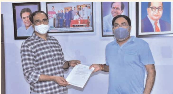
మునిసిపాలిటీ పరిధిలోని గ్రామాలకు 1.10కోట్లు, జగిత్యాల రూరల్ కు 1.65 కోట్లు, అర్బన్ కు 40 లక్షలు కేటాయిస్తూ ఉత్తర్వులు వెలువడ్డాయి. కోరిన దానికంటే అధిక నిధులిచ్చిన సందర్భంగా మంత్రి దయాకర్ రావుకు ఎమ్మెల్యే కృతజ్ఞతలు తెలిపారు.

జగిత్యాల జనపరి 22 (ప్రజామంటలు): జగిత్యాల నియోజకవర్గ అభివృద్ధి పనుల నిమిత్తం ఇటీవల పంచాయతీ రాజ్ శాఖ మంత్రి ఎర్రబెల్లి దయాకర్ రావు ను కలిసిన ఎమ్మెల్యే డా. సంజయ్ కుమార్. గ్రామ పంచాయతీలకు సీసీ రోడ్ల నిమిత్తం 3 కోట్ల 5 లక్షల మంజూరు చేయాలని వినతి పత్రం సమర్పించారు. ఎమ్మెల్యే వినతిపై సానుకూలంగా స్పందిస్తూ సారంగాపూర్ మండలానికి 55 లక్షలు, బీర్పూర్ మండలానికి 50 లక్షలు, రాయకల్