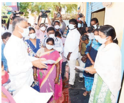
హైదరాబాద్, జనవరి 22:

కరోనా కట్టడిలో భాగంగా ఇంటింటా జ్వర వరీక్ష నిర్వహిస్తున్నారు. శుక్రవారం నుంచి ప్రారంభమైన ఈ సర్వేలో ఇప్పటివరకు 45,567 మందికి కరోనా లక్షణాలున్నట్లు అధికారులు గుర్తించారు. లక్షణాలున్న ప్రతిఒక్కరికీ హోం ఐసోలేషన్ కిట్స్ ను అందజేశారు. సర్వేలో చిన్నారులు, పెద్దవారి వివరాలు విడివిడిగా సేకరిస్తున్నారు. ఎక్కువ శాతం పెద్దవారిలోనే కరోనా లక్షణాలున్నట్లు గుర్తించారు. తీవ్ర కరోనా లక్షణాలుంటే వైద్య సిబ్బంది ఆస్పత్రిలో ఆడ్మిట్ చేస్తోంది. రాష్ట్రవ్యాప్తంగా కరోనా కేసులు పెరుగుతున్నాయి. వారం రోజులగా 3 వేలకు పైగా కేసులు నమోదు అవుతున్నాయి. అటు రాజకీయ పార్టీల నేతలు కూడా వైరస్ బారిన పడుతున్నారు. దీంతో రాష్ట్రంలో పొలిటికల్ యాక్టివిటీ తగ్గింది. వైరస్ వ్యాప్తి నేపథ్యంలో ఇప్పటికీ టీజేపీ ఆఫీస్ కు తాళం