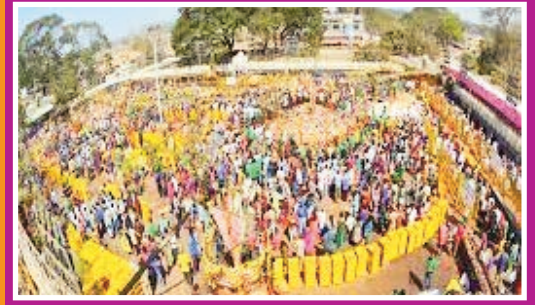
మేదారం జాతరపై మంత్రి సత్కృతి సమిష్టి కరోనా నిబంధనలకు అనుగుణంగా ఏర్పాటు