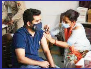
హైదరాబాద్, జనవరి 19:

విషయం ఇన్స్టిట్యూట్ ఆఫ్ గ్యాస్ట్రోఎంటరాలజీ చేత హైదరాబాద్ లో కోవిడ్ వ్యాక్సినేషన్ పొందిన 1,636 మంది ఆరోగ్య సంరక్షణ కార్యకర్తలపై ఒక