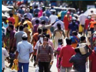
స్వాధీనీ, జనవరి 19: