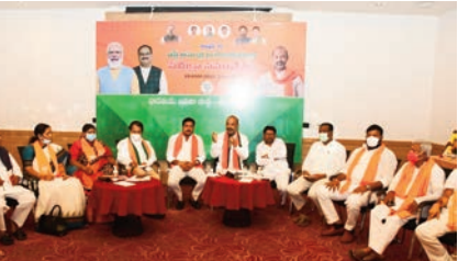
హైదరాబాద్, జనవరి 19:

పోడు భూములకు పట్టాలు ఇస్తానని చెప్పిన సీఎం కేసీఆర్ హామిని విస్మరించడమే గాకుండా.. గిరిజనులను మోసం చేశారని భాజపా రాష్ట్ర అధ్యక్షుడు బండి సంజయ్ అన్నారు. పోడ సమస్యలపై ఇప్పటికీ ఎలాంటి నిర్ణయం తీసుకోకుండా ఆదివాసీలను మోసం చేస్తూనే ఉన్నారని అన్నారు. అలాగే వారికి 12శాతం రిజర్వేషన్లు ఇస్తానని