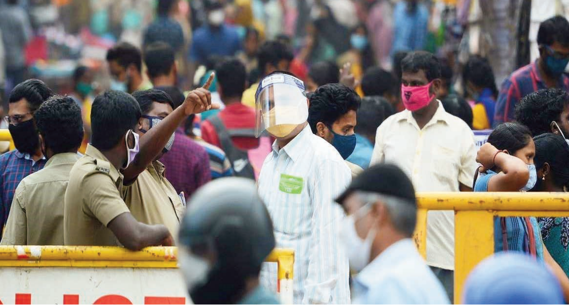
హైదరాబాద్, జనవరి 19:

నేడు కొవిడ్ నియంత్రణ చర్యలపై మంత్రుల సమీక్ష