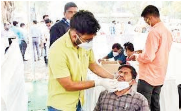
స్వాధీనీ, జనవరి 19:

దేశంలో కరోనా మహమ్మారి వ్యాప్తి రోజురోజుకూ పెరుగుతోంది. గతంలో ఎన్నడూ లేని విధంగా రోజువారీ కేసుల సంఖ్య భారీగా నమోదవుతోంది. రోజువారీ కేసుల సంఖ్య రెండు లక్షల మార్కు దాటి రోజురోజుకూ రికార్డు స్థాయిలో నమోదవుతున్నాయి. మరోవైపు మళ్ళీ భాక్ ఫంగస్ కేసు నమోదు కావడం ఆందోళన కలిగిస్తోంది. ఇదే సందర్భంలో కరోనా టెస్టుల సంఖ్యను పెంచాలని తాజాగా కేంద్రం రాష్ట్రాలను ఆదేశించింది. ఇదే సమయంలో దేశవ్యాప్తంగా